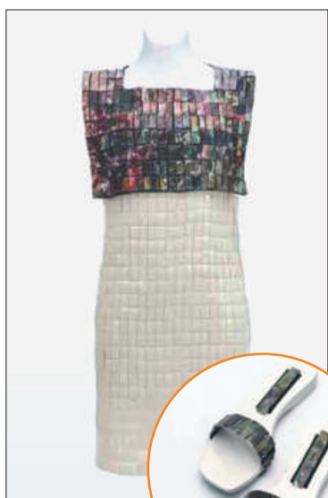
Комплект «Живопись». Платье: фарфор, органза, позолота. Туфли: дерево, шелковая тесьма, фарфор, позолота.

На экспозиции в Главном штабе представлено более 90 экспонатов, поражающих воображение. Посетители смогут увидеть уникальные фарфоровые платья из коллекций «Belle Époque», «Движение белого», «Та-кемет» и «Francisco».