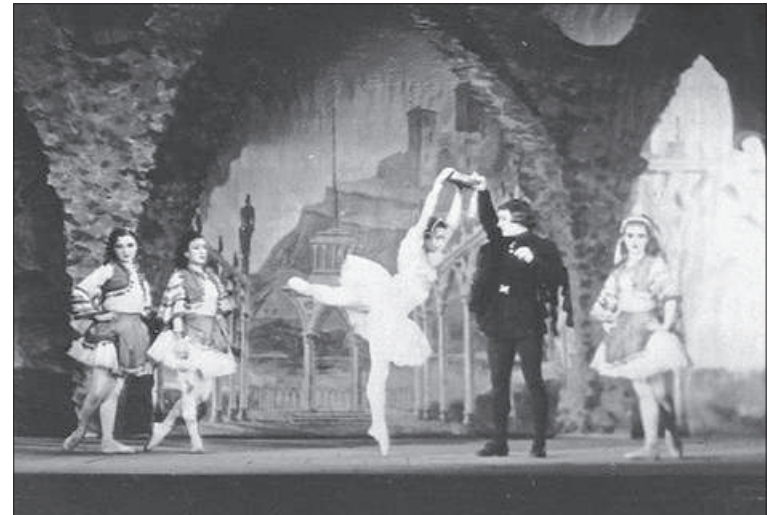
Сцена из балета «Эсмеральда». Ленинград. Фото 1942 г.