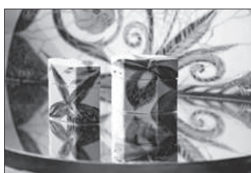
Флаконы для духов «Цветок»: фарфор, роспись подглазурная полихромная, надглазурная полихромная, позолота.

Напомним: цикл персональных выставок художников Императорского фарфорового завода в Государственном Эрмитаже – совместный проект ведущего музея страны и старейшего в России художественно-промышленного предприятия, запущенный в преддверии 275-летнего юбилея Императорского фарфорового завода. Выставка продлится до 10 марта.