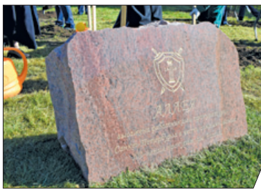
«ПРОКУРОРСКАЯ» АЛЛЕЯ НА КУРАКИНОЙ ДАЧЕ