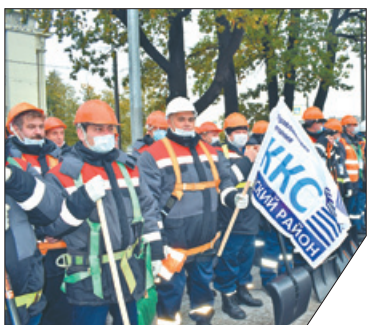
Кровельщикам предстоит обслуживать 789 жилых зданий.

Мероприятие прошло при участии главы района Алексея Гульчука, представителей Жилищного комитета Санкт-Петербурга, районного жилищного агентства и управляющих компаний «ЖКС № 1», «ЖКС № 2» и «Собрание». На смотре были продемонстрированы форменная одежда кровельщиков, рабочий инвентарь и средства безопасности. Функция специалистов данного профиля в зимний период – очистка крыш многоквартирных домов от снега. По информации управляющих компаний, в их штате 120 кровельщиков