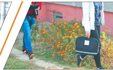
УБЕРЕЧЬСЯ ОТ «ЛИПОВЫХ» ПЕРЕПИСЧИКОВ