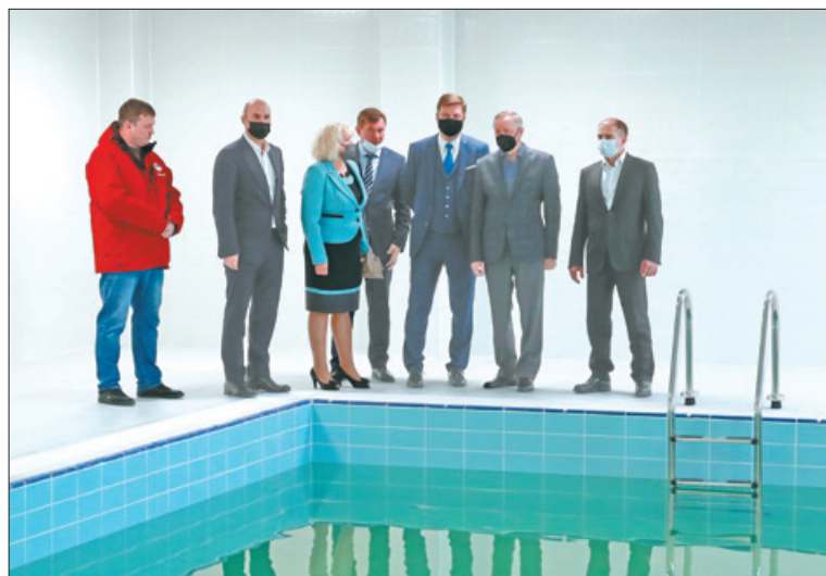
«Теперь это наша петербургская марка – строить школы, сады и поликлиники с бассейнами», – отметил губернатор.

Александр Беглов вручил билет почётного читателя жительнице района, которая посещает библиотеку с 1974 года.