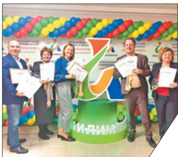
Впереди – борьба за первенство на Национальном чемпионате. Удачи всем участникам!

В Охтинском колледже подвели итоги VI Регионального чемпионата по профессиональному мастерству среди инвалидов и лиц с ограниченными возможностями. Более 600 участников соревновались в 70 компетенциях. Большое количество победителей и призеров подготовили руководители и педагоги Невского района, который был признан лидером по развитию движения «Абилимпикс» в Санкт-Петербурге.