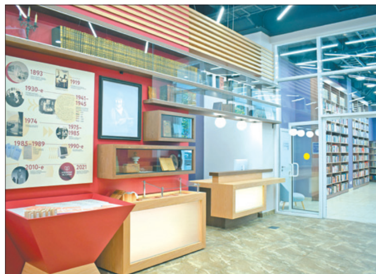
Библиотека им. Н. К. Крупской открылась после капитального ремонта.

Финансирование работ по капитальному ремонту осуществлено за счёт средств бюджета Санкт-Петербурга.