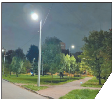
В 2021 году современное освещение получают четыре квартала Невского района.

В Невском районе в квартале в границах улиц Цимбалина и Седова, Железнодорожного и Белевского проспектов завершилась реконструкция наружного освещения. Ранее источники света в жилом массиве были размещены на тросовых растяжках вдоль двух основных проездов. Теперь в квартале установлено 137 светодиодных светильников. Современное светотехническое оборудование длительного времени не будет нуждаться в обслуживании.