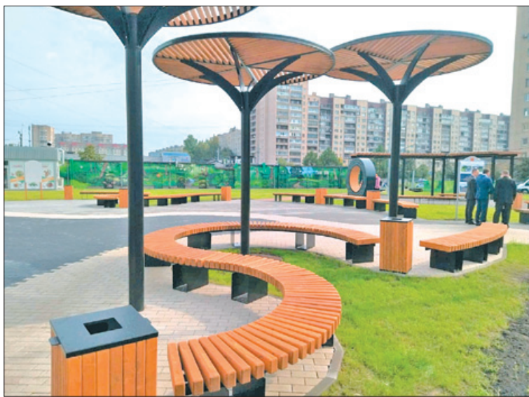
На месте сквера у дома № 3 по проспекту Большевиков раньше был пустырь, где несанкционированно парковались автомобили.

Два года назад бесхозный участок был включён в список территорий зелёных насаждений общего пользования местного зна-