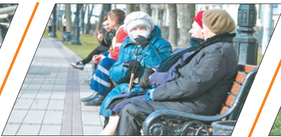
ВЫПЛАТЫ ПОКОЛЕНИЮ ВОЕННОГО ЛИХОЛЕТЬЯ