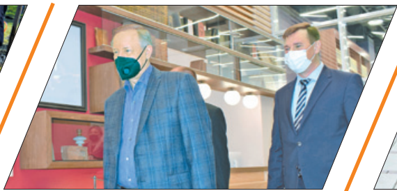
РАБОЧИЙ ОБЪЕЗД РАЙОНА ГУБЕРНАТОРОМ