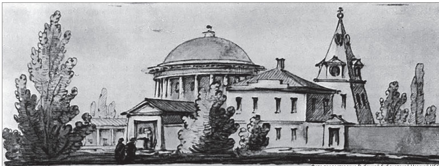
Джакомо Кваренги. Свято-Троицкая церковь.

рые впервые соединил в единой композиции в селе Александровское под Петербургом. Удачные архитектурно-строительные эксперименты были продолжены в собственной усадьбе Львовых в селе Черенницы (во время строительства местного храма Николай Александрович переименовал село в «Никольское»). Здесь, в построенном им – более сложном, чем в селе Александровское – двухэтажном Воскресенском храме (ротонде-«куличе») находится фамильная усыпальница Львовых.