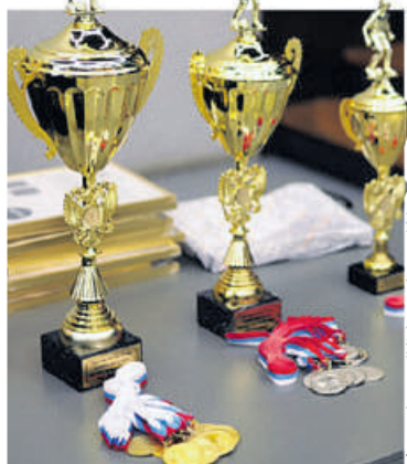
Фото: https://disk.yandex.ru/d/CCS96eBc5UU8Mg .