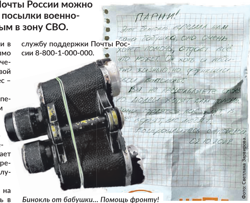
Бинокль от бабушки... Помощь фронту!

службу поддержки Почты России 8-800-1-000-000.