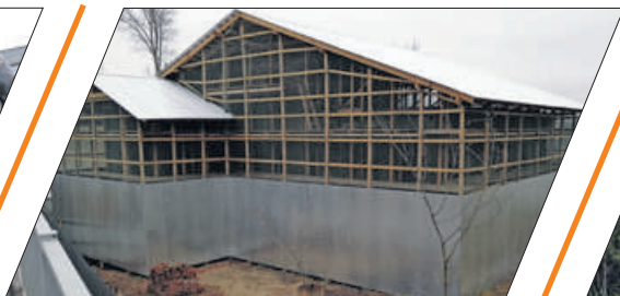
ДОМ СЛЕПУШКИНА БУДЕТ ВОССТАНОВЛЕН