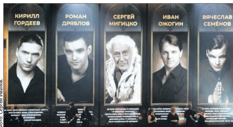
Непривычно видеть Сергея Мигицко среди вокалистов мюзиклов.

Возможно, кого-то удивило присуждение премии в номинации «Лучшая мужская роль в мюзикле» народному артисту России Сергею Мигицко, который, по его собственному признанию, впервые вышел на сцену в мюзикле. Артист стал обладате-