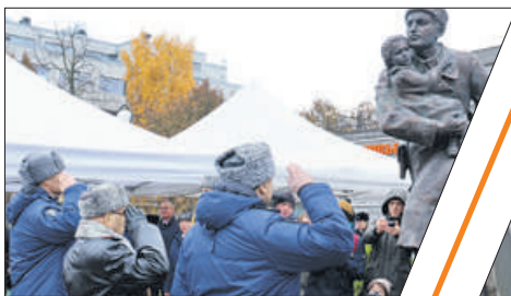
ПОДВИГУ БЛОКАДНОГО УЧАСТКОВОГО