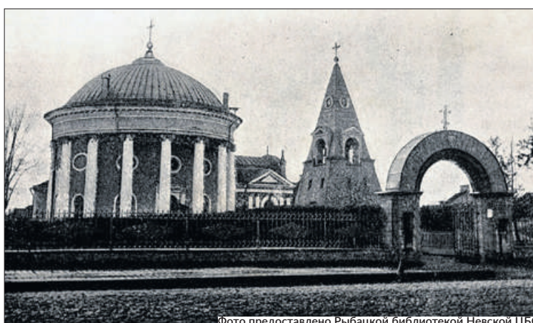
Наружный вид церкви Святой Троицы в селе Александровском, за Невской заставой.

Историки архитектуры утверждают, что композиция храма с колокольней «Кулич и Пасха» в Петербурге восходит к пирамидо-гробнице проконсула Цестия и древнеримскому храму богини Весты в виде ротонды в Риме (или к храму Весты в Тиволи, или к Темплетто Д. Браманте в Виченце) – постройкам, которые Н. А. Львов наблюдал в Италии в 1781 году и которыми он особенно восхищался. Любование римской архитектурой не прошло даром. Впоследствии мастер часто обращался к этим формам, кото-