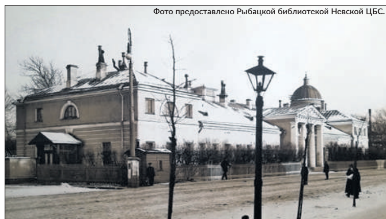
Дом начальника завода (фото, конец XIX в.)

справа от центрального здания. Позднее одно из трёх зданий получило название «Дом начальника завода» (Обуховского) – оно стоит там и сегодня в сильно пе-