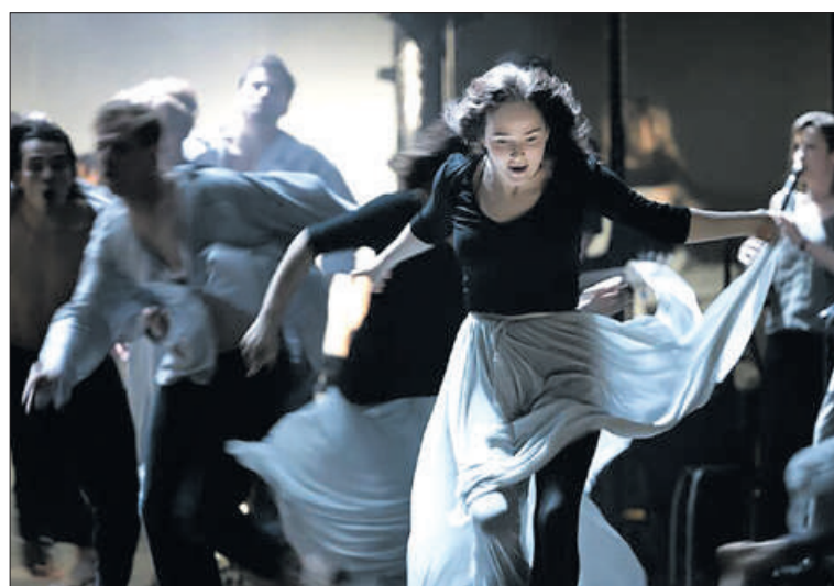
Спектакль «Гроза» московского театра «Сатирикон» имени Аркадия Райкина.