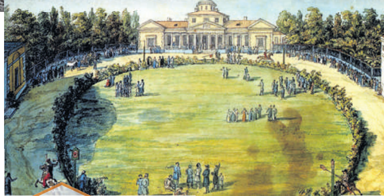
Усадьба Апраксиных в Мурзинке, 1820-е гг.

селе Введенское близ Звенигорода – также работы Н. А. Львова (см. рисунок усадебного дома 1868 г.). Историки архитектуры – «львоведы» пока не проводили экспертных исследований по апраксиной усадьбе, но некоторые краеведы уже высказывались здесь в пользу авторства Львова. Эта история возможного открытия, конечно, нуждается в более продолжительном исследовании,