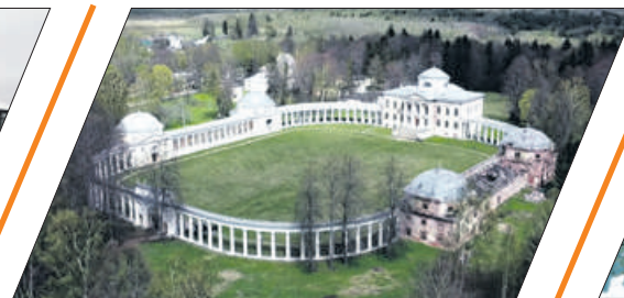
ГЕНИЙ МЕСТА: АРХИТЕКТОР ЛЬВОВ