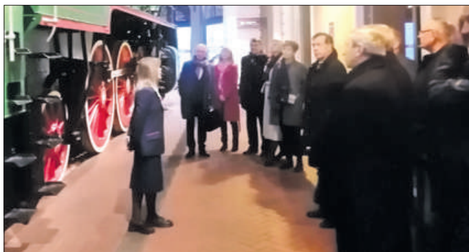
Перед началом заседания члены Совета ТПП ознакомились с интереснейшей экспозицией крупнейшего в мире музея железных дорог России.

Участники, среди которых были руководители организаций и Невского района, ознакомились с деятельностью и перспективами развития Октябрьской железной дороги, рассмотрели инвестиционный стандарт Петербурга, который предста-