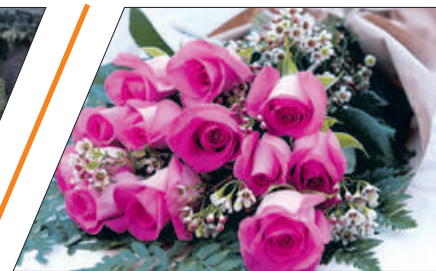
ДЕНЬ МАТЕРИ В БИБЛИОТЕКАХ РАЙОНА