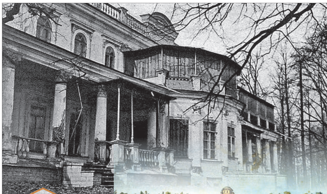
Усадебный дом Апраксиных, 1914 г.

в непосредственной близости от Рыбацкого (с 1934 года на её месте действует Южная водопроводная станция). Лишь в начале 2000-х годов в России смогли увидеть, как выглядела эта усадьба и её особняк в начале XIX века. Тогда из Италии на выставку в Русский музей привезли уникальные акварели, выполненные в 1820-х годах одним из владельцев Мурзинки, внуком А. А. Вяземского Николаем Антоновичем Серра-Каприола. Усадьба была выстроена примерно в то же время, что и церковь «Кулич и Пасха». Не известно ни о каких документах по истории её строительства и её творце (впрочем, как и о других усадьбах с. Александровское, не исключая самого храма). Это вообще характерно для всей истории творчества нашего героя. Нет авторских документов даже по знаменитой усадьбе под Торжком Знаменское-Раёк. Но, рассмотрев внимательно эти акварели, можно отметить явные параллели между запечатлёнными на них постройками и творческим почерком Н. А. Львова – особенно если сравнить усадьбу Апраксиных с усадьбой Знаменское-Раёк. И не только с ней. Сходство можно усмотреть и с усадьбой в