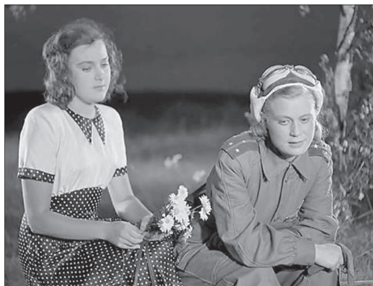
«Всякий раз, когда я смотрю фильм «Небесный тихоход», я вижу свой букет ромашек».

Всякий раз, когда я смотрю фильм «Небесный тихоход», я вижу свой букет ромашек. И мне становится радостно, как будто это мой кинодебют.