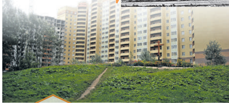
Вид холма, на котором находилась церковь во имя Преподобного Серафима Саровского. Ново-Александровская ул., д. 14.