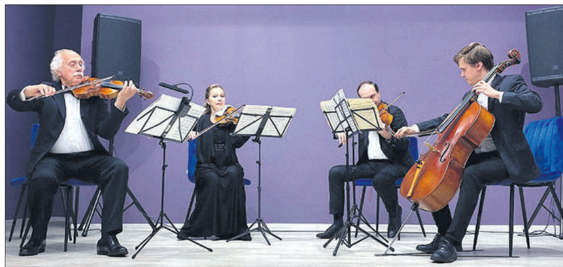
Музыкальный подарок от струнного квартета им. Н. А. Римского-Корсакова.