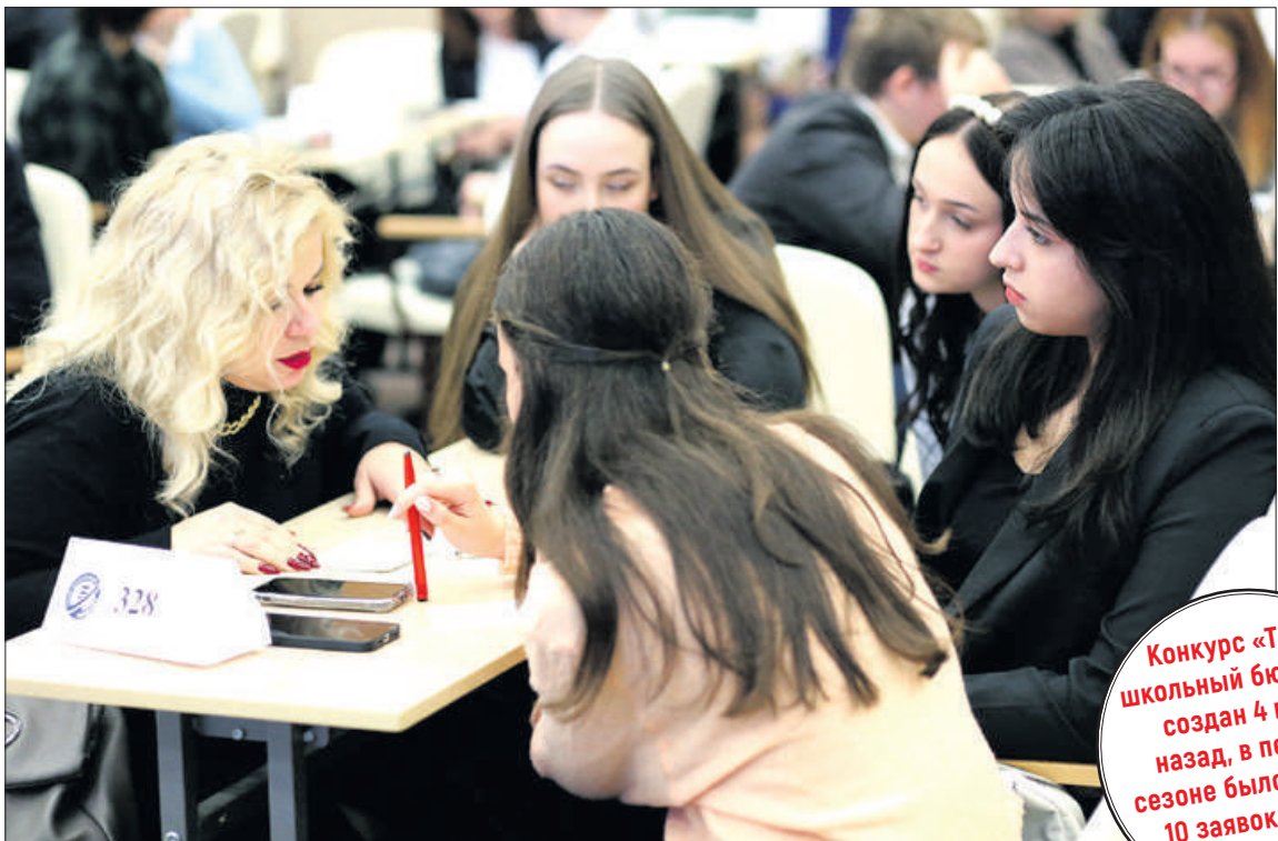
Ребята приняли участие в тренинге «Дерево проблем» и узнали секреты создания эффективных презентаций.

Конкурс «Твой школьный бюджет» создан 4 года назад, в первом сезоне было подано 10 заявок, в этот раз – уже 40!