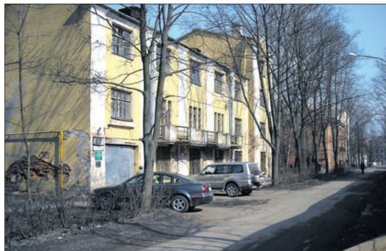
Ново-Александровская ул., д. 5А.

волюционной истории Невской заставы. Вокруг музея через несколько лет оформили мемориальную площадку. В 1995 г. музей изменил свой статус на историко-краеведческий и получил название «Невская застава».