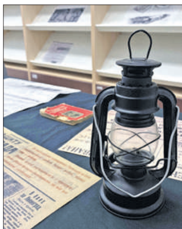
Экспозиция «Библиотека во времени» рассказала о том, как менялась страна и наша библиотека вместе с ней.

И даже при такой большой загруженности команда библиотеки № 1 им. Н. К. Крупской «Переплёт» успела принять участие во Всероссийском фестивале «Книжный маяк Петербурга», который также прошёл в октябре, с челленджем «Маяк читающий», объединившим книголюбов из разных уголков страны.