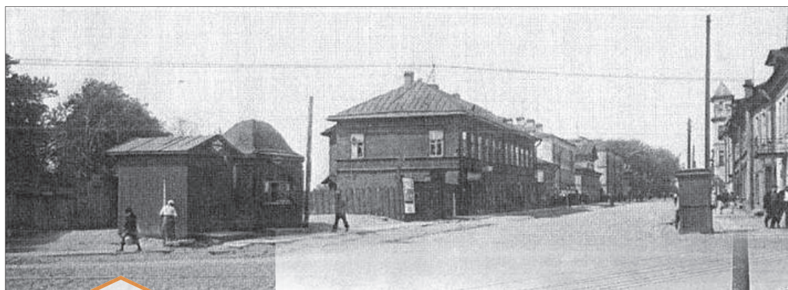
Ново-Александровская ул. Вид с пр. Обуховской Обороны. 1934 г.

Между домами № 3 и № 5А на Ново-Александровской улице, внутри квартала, расположено старинное краснокирпичное здание пекарни. До революции 1917 г. пекарня принадлежала Николаю Тимофеевичу Тимофе-