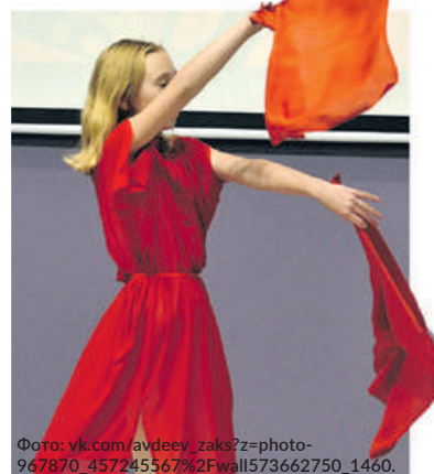
В октябре в библиотеке прошёл «Пионерский марафон».

Библиотека стала первой за Невской заставой «народной читальней», открытой «Невским обществом устройства народных развлечений» в сентябре 1893 года. Первоначально она располагалась на левом берегу Невы, а в 1974 году переехала на правый берег, в специально спроектированное помещение на первом этаже жилого дома, в котором располагается и сейчас.