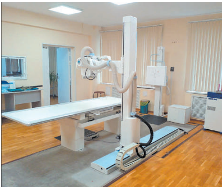
Свойства аппарата облегчают проведение исследований детям, пожилым людям, а также пациентам с ограниченными возможностями.