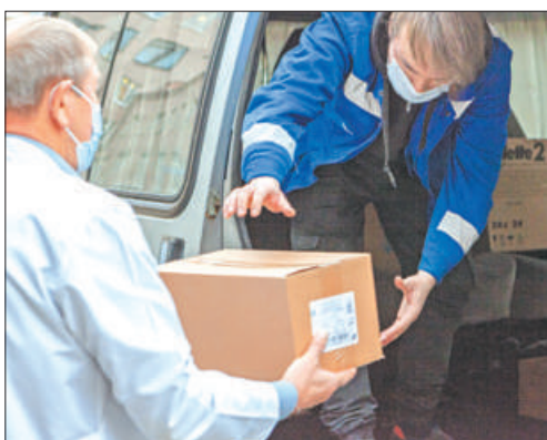
Госпиталь для ветеранов войн передал более 50 коробок гуманитарной помощи в пункт приёма, расположенный на базе Центра спорта Невского района.

заявлений на регистрацию брака летом 2023 года принято за один день в ЗАГСах города.