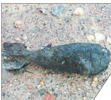
На полигоне боеприпас уничтожили с соблюдением всех мер безопасности.

Во время проведения земляных работ на Складской улице нашли предмет, похожий на боевой снаряд. Жители Невского района и рабочие в срочном порядке отошли на безопасное расстояние от находки. Очевидцы вызвали на место инцидента сотрудников Росгвардии. Объект осмотрели члены группы разминирования ОМОН «Бастион». Обследовав предмет, специалисты установили, что это неразрывавшаяся 82-миллиметровая миномётная мина времён Великой Отечественной войны в состоянии коррозии.