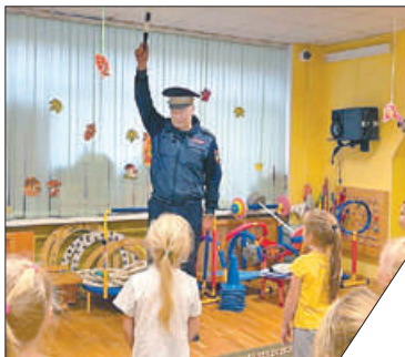
Ребятам очень понравились сигналы регулировщика.

6 октября сотрудники ОГИБДД УМВД России по Невскому району провели в детских садах №№ 62 и 119 мероприятия, посвящённые знаниям основных Правил дорожного движения. Ребятам рассказали о безопасности передвижения по внутридворовым территориям, правилах перехода проезжей части, обсудили назначение светофора и его сигналы. В ходе мероприятия инспектор рассказал юным пешеходам о том, что такое дорожные знаки и что они обозначают, а также продемонстрировал сигналы регулировщика.