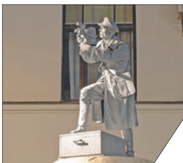
Световое оформление получили свыше 140 памятников.

Памятник фронтовому кинооператору – новая достопримечательность Петербурга – оформлен подсветкой. Теперь он гармонично сливается с вечерней панорамой города, обращает внимание на расположенную рядом территорию киностудии «Ленфильм». Благодаря удачному расположению скульптура кинооператора в военной форме хорошо просматривается со всех сторон.