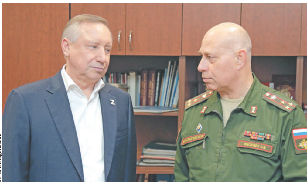
Губернатор Александр Беглов посетил военный комиссариат Невского района. Он ознакомился с работой районной призывной комиссии по частичной мобилизации граждан.

Первая партия гуманитарной помощи для мобилизованных уже направлена в воинские части. В сборе предметов первой необходимости для бойцов принимали участие сотрудники центра, семьи занимающихся в секциях детей, спортсмены расположенной здесь школы Тамары Москвиной, а также жители района.