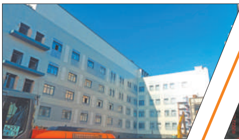
НОВЫЙ КОРПУС БОЛЬНИЦЫ