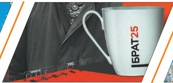
ИФЗ К 25-ЛЕТИЮ ФИЛЬМА «БРАТ»