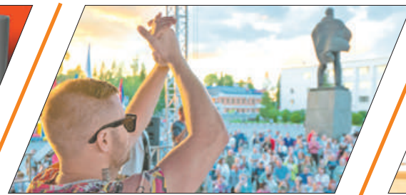
ЗВЕЗДА ИЗ РЫБАЦКОГО