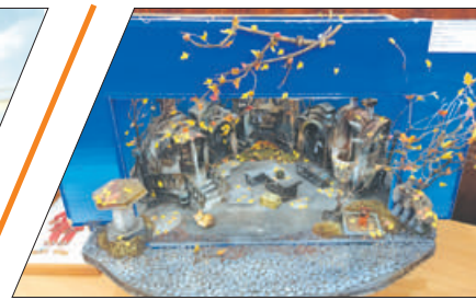
КАК ПОПАСТЬ В СКАЗКУ?