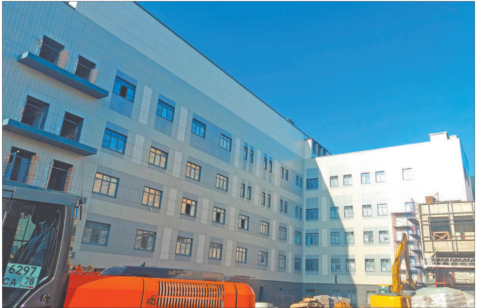
Впервые на Северо-Западе здание центра специально построено с учётом всех требований логистики, необходимых при оказании медицинской помощи пациентам сосудистого профиля.

В целях дооснащения в соответствии со стандартом оказания медицинской помощи населению в поликлинику № 77 Невского района закуплен новый аппарат для проведения рентгенологических исследова-