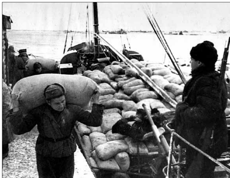
В самые напряженные дни 1942 г. ежедневно через рейды Осиновецкого порта проходило до 150 различных судов.