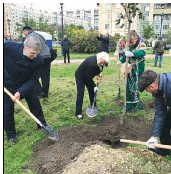
Теперь на новой Аллее городского электрического транспорта будет расти 20 кленов.

Сектор информации администрации Невского района