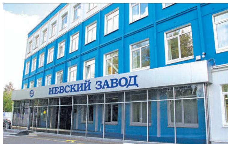
Завод был основан в 1857 году как судостроительный для обеспечения потребностей государственного заказа Морского ведомства на изготовление броненосных кораблей.

Поздравляя коллектив завода, Александр Бельский отметил: «В это непростое для нашей страны время, когда мы столкнулись с серьёзным санкционным давлением, ваша продукция – под-