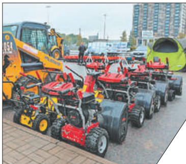
Уборочная техника к зиме готова.

В Невском районе проверили готовность коммунальных служб к работе в осенне-зимний период. На площадке перед торговым комплексом «Лондон Молл» 5 октября прошёл традиционный смотр техники для уборки внутриквартальных территорий Невского района. По результатам смотра к предстоящему осенне-зимнему периоду допущены к работе 62 единицы техники.