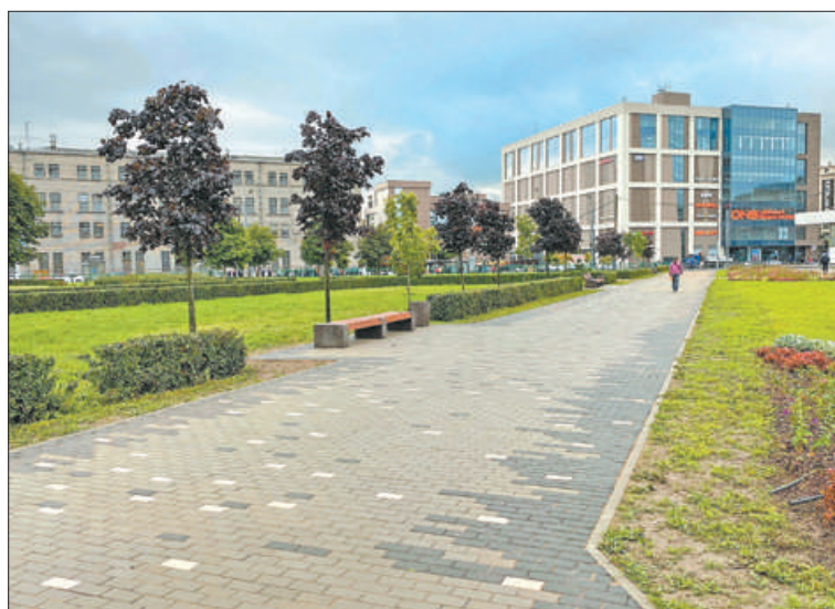
В Ломоносовском саду уже высажены многочисленные флоксы, впереди посадка крокусов и нарциссов.

Первое благоустройство Ломоносовского сада было выполнено ещё в 2011 году. С тех пор масштабного ремонта не было. В этом сезоне акцент был сделан на цветочное оформление.