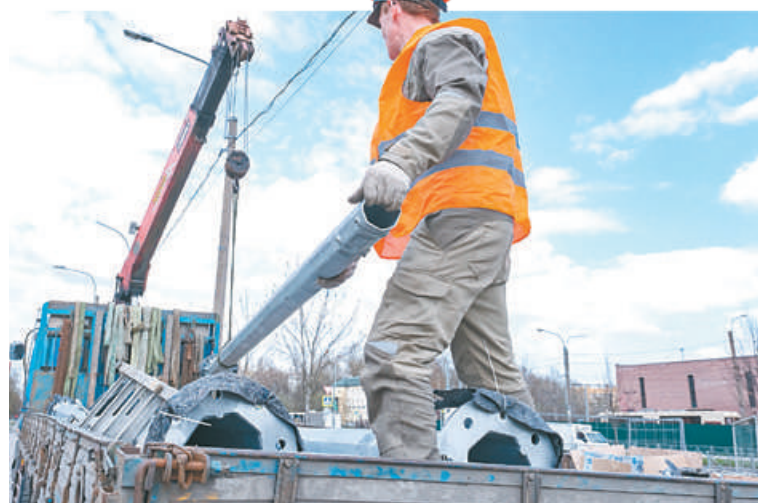
До конца года реконструкция освещения запланирована на территории квартала в границах улиц Бабушкина, Ольги Берггольц, Пинегина и проспекта Елизарова. Появятся фонари в саду Печатников на проспекте Обуховской Обороны. Завершены работы на улицах Шотмана и Лопатина. Фонари установлены на улице Грибакиных, продолжается реконструкция на улице Крыленко.

Также современная система наружного освещения установлена на улице Лопатина, кото-