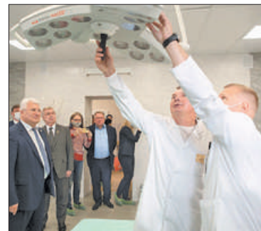
После ремонта проведено комплексное оснащение отделения медицинским оборудованием и мебелью.