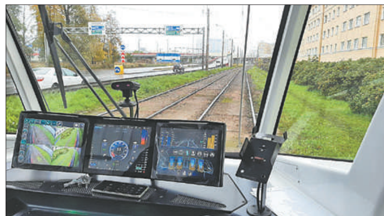
До конца октября планируется поставка еще 9 «умных» трамваев.