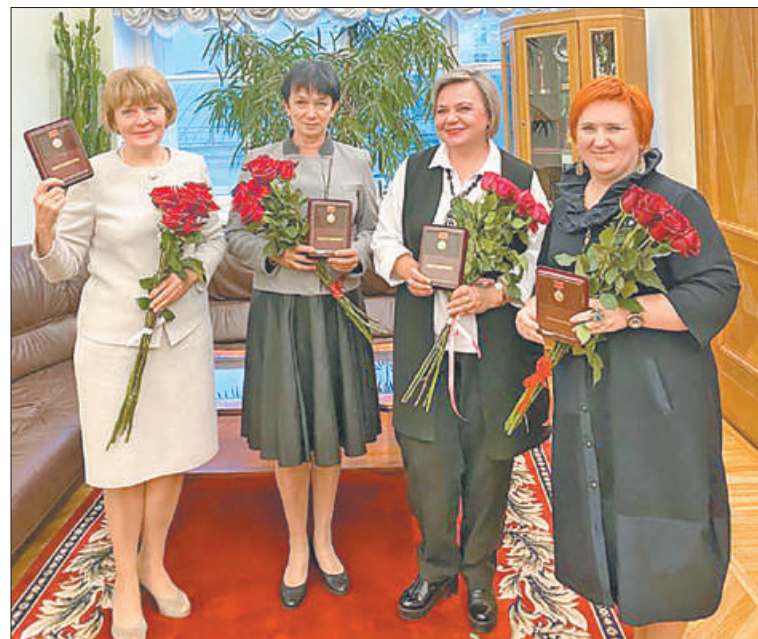
Поздравляем педагогов Невского района с заслуженной наградой!