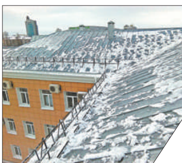
«Греющая лента» будет бороться с наледью.

Продолжается реализация комплексного подхода к уборке крыш в зимний период. Предстоящей зимой планируется активно применять технологии «греющей ленты» на кровлях и свесах домов в разных районах Петербурга. На сегодняшний день такая система установлена уже более чем в 100 домах. Разработчик «греющей ленты» активно сотрудничает с Жилкомсервисами Петроградского, Красносельского, Невского и Фрунзенского районов. Неотъемлемым плюсом «греющей ленты» является простота крепления.