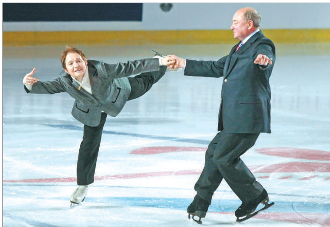
Выдающиеся спортсмены и легендарные тренеры – Тамара Москвина и Алексей Мишин.