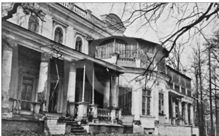
Помещичий дом в Мурзинке 1918 г.

Степан Антонович Апраксин (1869–1930), видимо, не блистал способностями. Он получил только домашнее образование. В 1888 г. он был определён на службу почётным членом Охтинского ремесленного училища. В 1889 г. – причислен к Собственной его императорского величества канцелярии по учреждениям императрицы Марии. В том же году был назначен почётным членом Совета Свято-Троицкого Богдельного дома в Ораниенбауме, а в 1890 г. – утверждён на три года почётным попечителем Санкт-Петербургской седьмой гимназии и произведён в чин коллежского регистратора. Во всех этих учреждениях содержания он не получал. В 1891 г., в возрасте двадцати одного года, он уже был женат на княжне Анне Николаевне Баратовой. По его прошению был принят в Совет детских при-