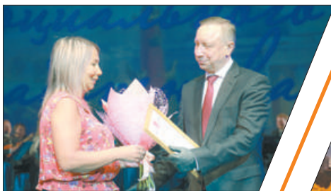
ГУБЕРНАТОР ПОЗДРАВИЛ ЛУЧШИХ