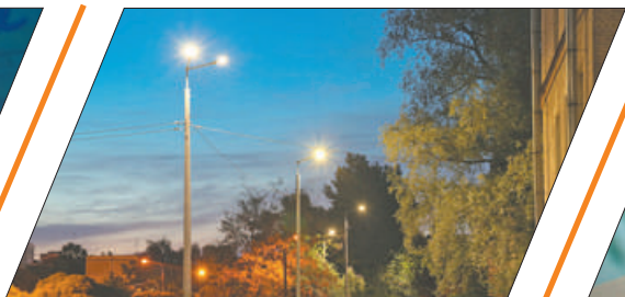
В РАЙОНЕ СТАЛО СВЕТЛЕЕ