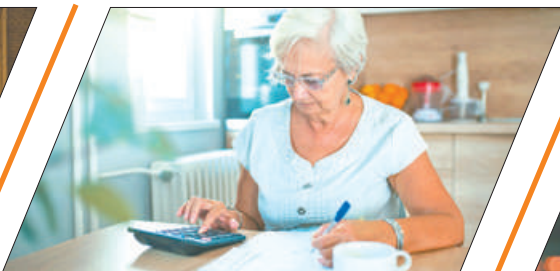
ИНДЕКСАЦИЯ ПЕНСИИ ПРИ УВОЛЬНЕНИИ