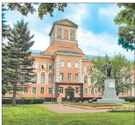
Невский завод, основанный в 1857 году, имеет богатую промышленную историю.

Сократив время производства на пилотном участке в три раза, с 2019 года предприятие активно развивает культуру непрерывных улучшений и тиражирует опыт на различные производственные потоки. Управление из мест создания ценности, рационализаторские предложения, организация рабочих мест по системе 5S позволят достичь ключевых показателей по 12 производственным и вспомогательным