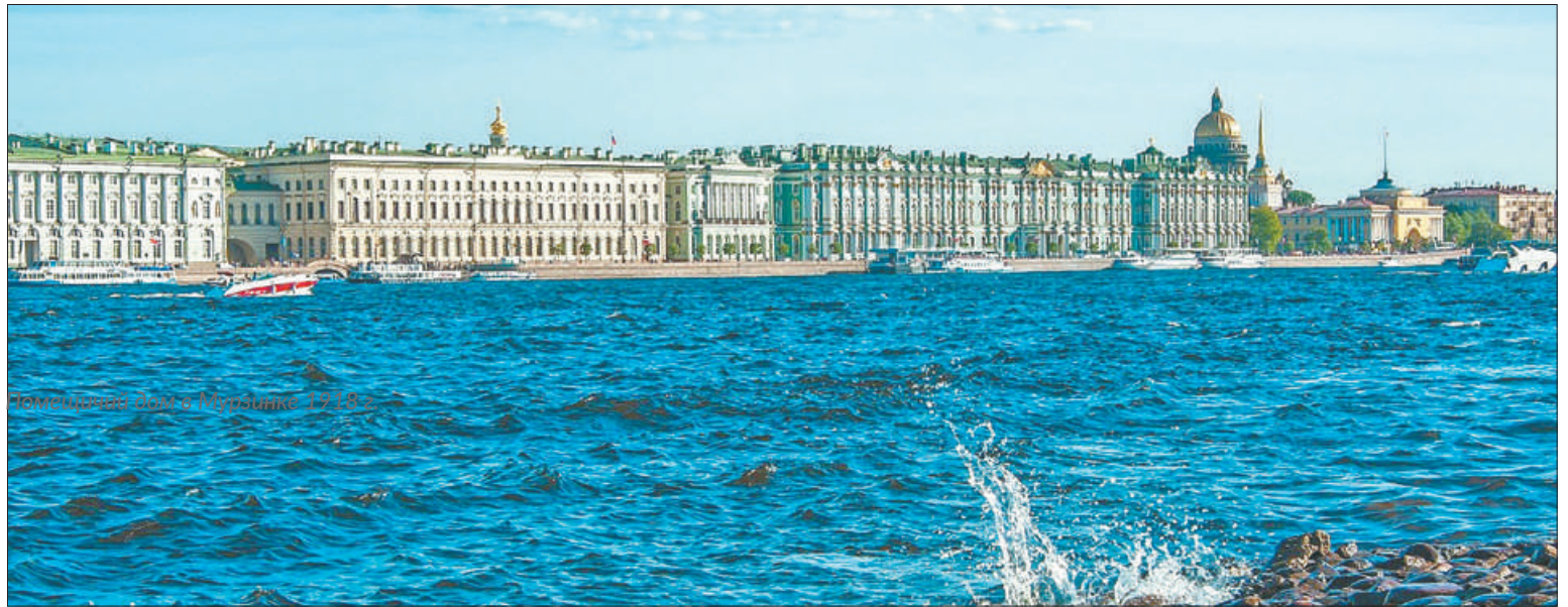
Помпидовый мост в Петербурге. 17.10 г.

На заседании совета также были рассмотрены вопросы экологического благополучия водных объектов на территории Санкт-Петербурга и пути их оздоровления. В частности, участники обсудили первоочередные мероприятия по прекращению сброса в водные объекты неочищенных сточных вод. Принято решение под-