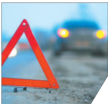
За семь месяцев по вине водителей произошло 14 ДТП.

Заканчиваются летние каникулы у детей, наступает новый учебный год. Госавтоинспекция Невского района напоминает водителям о том, как важно быть предельно внимательными к маленьким пешеходам. Будьте бдительны при движении в жилой зоне или по дворовой территории! Соблюдение Правил дорожного движения, поможет нам уберечь детей от травм и увечий. По итогам 7 месяцев 2020 года на территории Невского района произошло 22 дорожно-транспортных происшествия с участием детей. Один ребёнок, к несчастью, погиб.