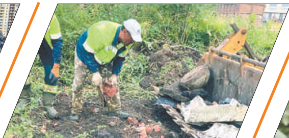
КОГДА БУДУТ ЛИКВИДИРОВАНЫ СВАЛКИ?