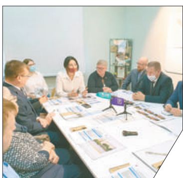
В октябре этого года, сквер уже примет первых гостей.