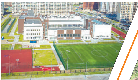
ШКОЛЫ XXI ВЕКА К 1 СЕНТЯБРЯ