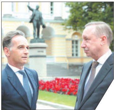
Хайко Маас отметил важность личных встреч с блокадниками прежде всего для молодёжи Германии.

ФРГ передала медицинское оборудование госпиталю для ветеранов войн. Об этом сообщил федеральный министр иностранных дел Германии Хайко Маас на встрече с губернатором Санкт-Петербурга Александром Бегловым. «Это признание нашей исторической ответственности за то, что произошло в прошлом, это жест в адрес блокадников», – сказал он. Первая партия оборудования для модернизации реабилитационного центра на сумму более чем 2 млн евро уже поступила в госпиталь.