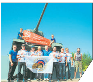
Участники экскурсии прошли дорогой подвига наших отцов и дедов.

Работники Октябрьского электровагоноремонтного завода присоединились к экскурсии, организованной по инициативе регионального отдела профсоюза Дорпрофжел для участников велопробега, посвящённого 75-й годовщине Победы в Великой Отечественной войне и 115-летию Роспрофжел. Участники экскурсии посетили памятник героической «полуторке», музей-диораму «Прорыв блокады Ленинграда» и другие памятные места.