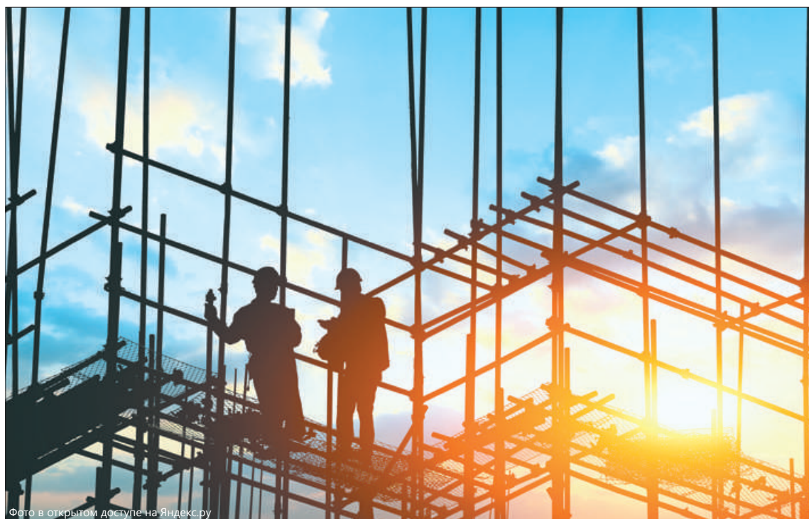
Одним из секторов экономики, показавшим в первом полугодии рост, является строительство. За шесть месяцев в городе было введено 700 тысяч квадратных метров жилья.

Наиболее пострадавшими стали отрасли потребительского сектора экономики. В частности, оборот розничной торговли снизился на 8,1%. Но необходимо отметить, что в период пандемии с дефицитом продуктов город не столкнулся благодаря бесперебойной ра-