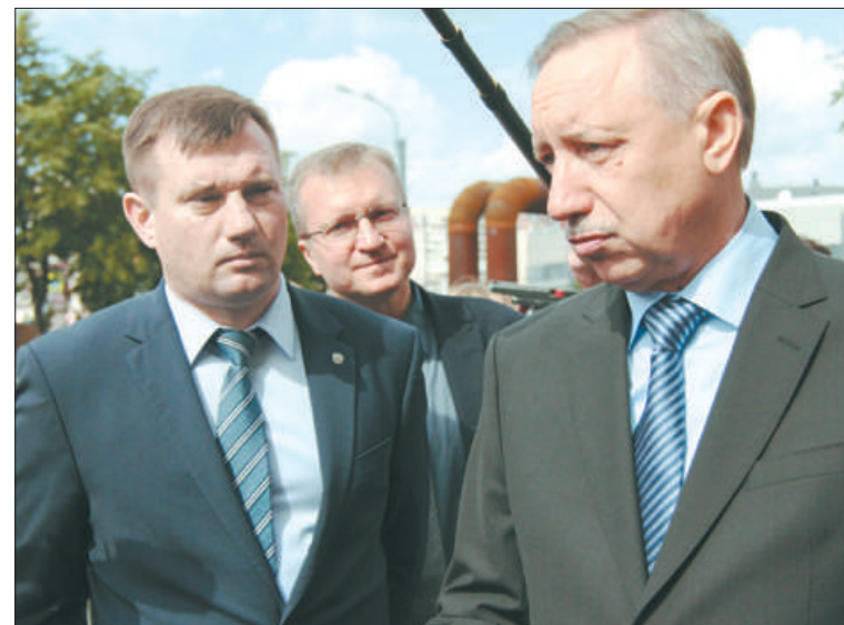
«Реконструкция системы теплоснабжения должна быть комплексной – нужно не только менять аварийные участки магистральных трубопроводов, но и модернизировать котельные, а также внутриквартальные инженерные сети», – убеждён глава города Александр Беглов.

Тем временем, Александр Беглов проверил ход работ по реконструкции устаревшей Пороховской тепломагистрали. Прошедшей зимой на ней было зафиксировано четыре серьёзных прорыва. Тогда же было принято решение построить к новому