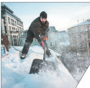
В 2020 году для уборки внутриквартальной территории необходимо 4,1 млрд руб.

Жилищный комитет Санкт-Петербурга зарезервирует 500 койко-мест для размещения дворников и кровельщиков, которые будут привлекаться из других регионов для уборки петербургских улиц зимой. По словам председателя Жилищного комитета, сейчас недоукомплектованность штата дворников и кровельщиков составляет порядка 20%. С учётом опыта прошлой зимы, в комитете не исключают, что для уборки потребуется дополнительно привлечь людей из других регионов.