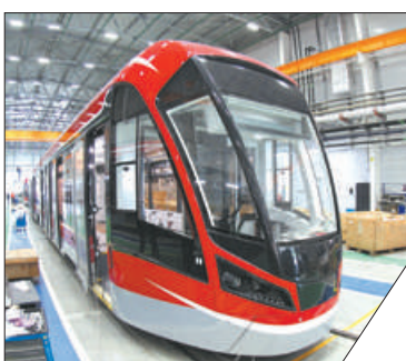
За время работы завод выпустил уже более 200 новых трамваев.

В 2019 году СПб ГУП «Горэлектротранс» закупает 21 современный низкопольный вагон Витязь-М. В каждой машине по три секции, более 60 посадочных мест, а главное – низкий пол и шесть широких дверей, которые позволяют принимать и выпускать больше пассажиров. Эти низкопольные трамваи крайне удобны для инвалидов, пожилых людей и мам с колясками. Все трамваи собраны на Невском заводе электрического транспорта, который начал работать в 2018 году.