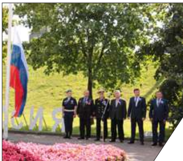
С торжественной речью выступил глава администрации Невского района Алексей Гульчук.

В День Государственного флага Российской Федерации, 22 августа, на площадке перед зданием администрации Невского района у Володарского моста состоялся торжественный церемониал. В мероприятии приняли участие представители администрации района, Законодательного собрания Петербурга, муниципальных образований. Молодым жителям района в торжественной обстановке были вручены паспорта.