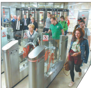
Власти планируют выдать до конца года 400 тыс. Единых карт петербуржца.

Правительство Санкт-Петербурга утвердило тарифы льготного проезда на метро для владельцев Единой карты петербуржца и карты «Мир». Воспользоваться новым тарифом можно будет уже в сентябре. Стоимость проезда при оплате в турникете картой «Мир» составит 35 рублей, владельцы Единой карты петербуржца заплатят ещё меньше – всего 30 рублей. Сейчас стоимость одной поездки на метро составляет 45 рублей.