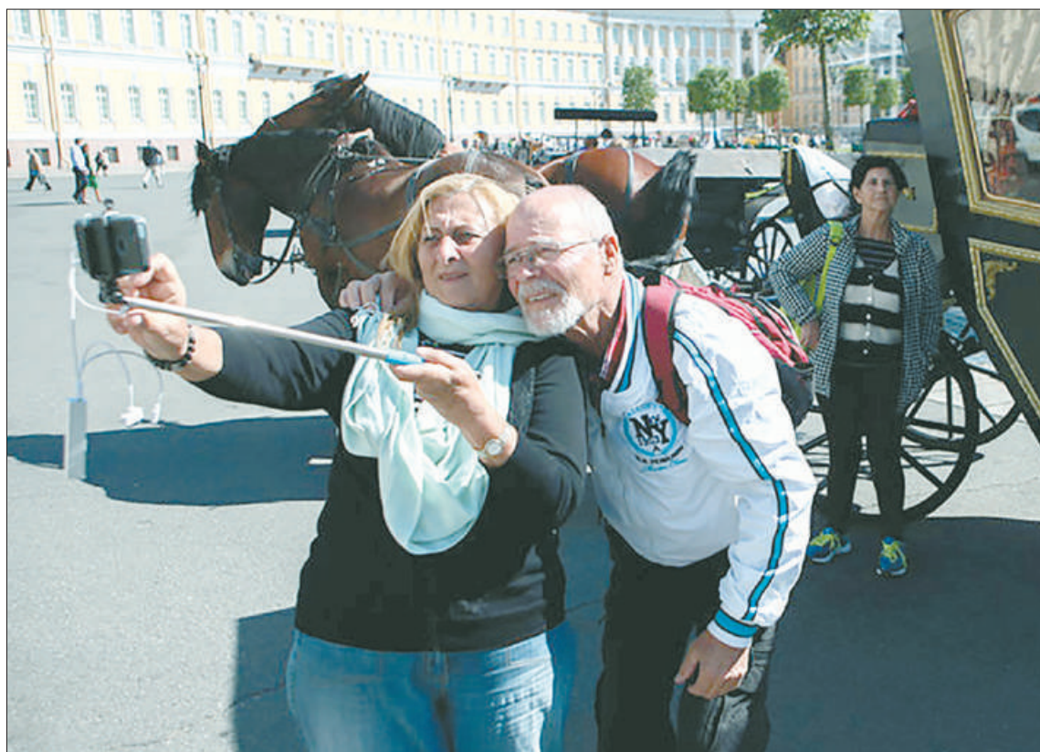
Среди пожилых людей очень активно развивается такое понятие, как социальное добровольчество.