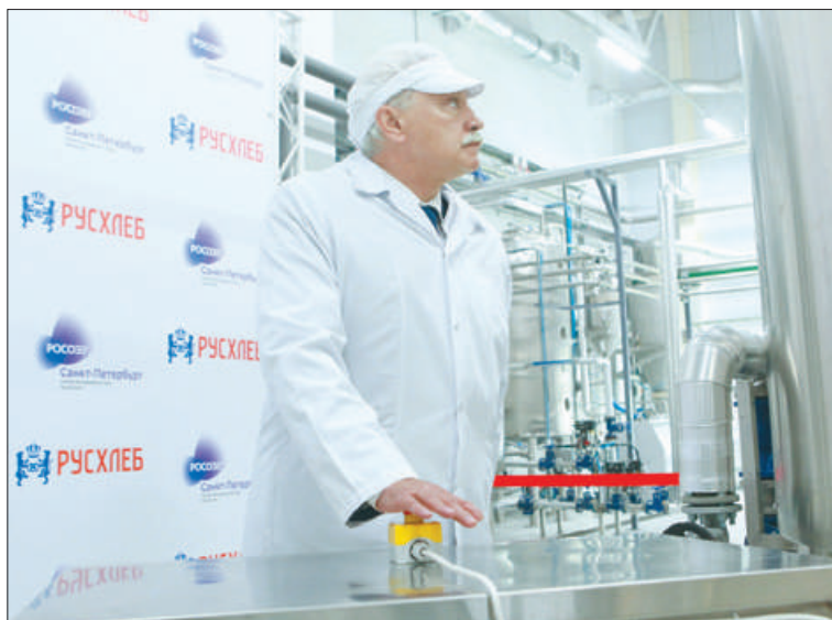
В церемонии запуска нового производства принял участие губернатор Георгий Полтавченко.

Первый в России завод по производству сухих продуктов брожения для производства хлебобулочных изделий начал работу в Особой экономической зоне технико-внедренческого типа «Санкт-Петербург».