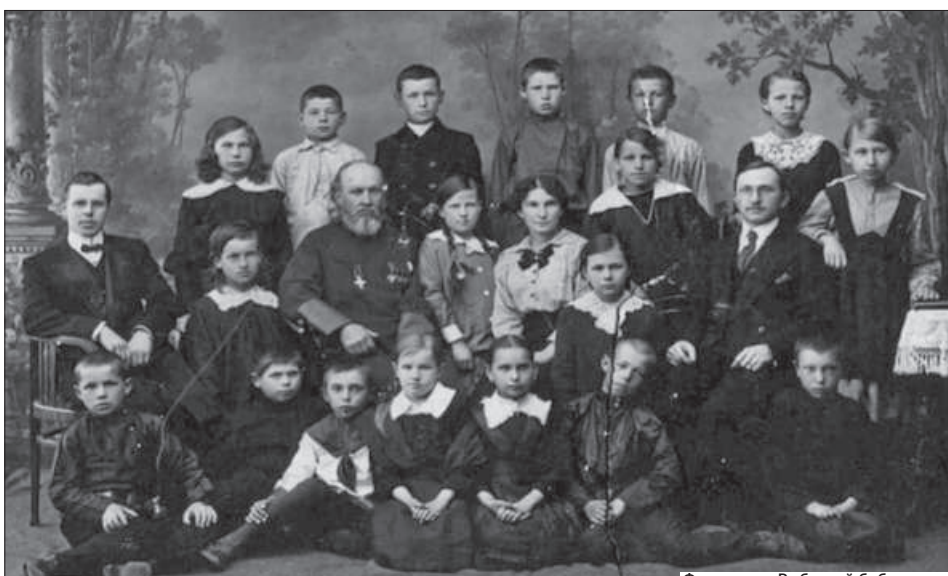
Класс Рыбацкой школы, около 1917 г..