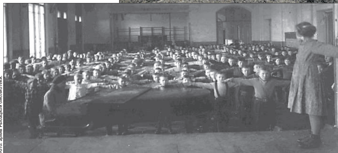
Училищный дом. 1 ноября 1909 г.

ило в Училищном доме интернат для детей железнодорожников. Были выделены деньги и проведён ремонт. Школа стала 9-летней, в ней был организован хор из учащихся и жителей села Рыбацкое, а в 1924 году здесь зародился первый пионерский отряд, которому в 1965 году присвоили имя Героя Советского Союза Рихарда Зорге.