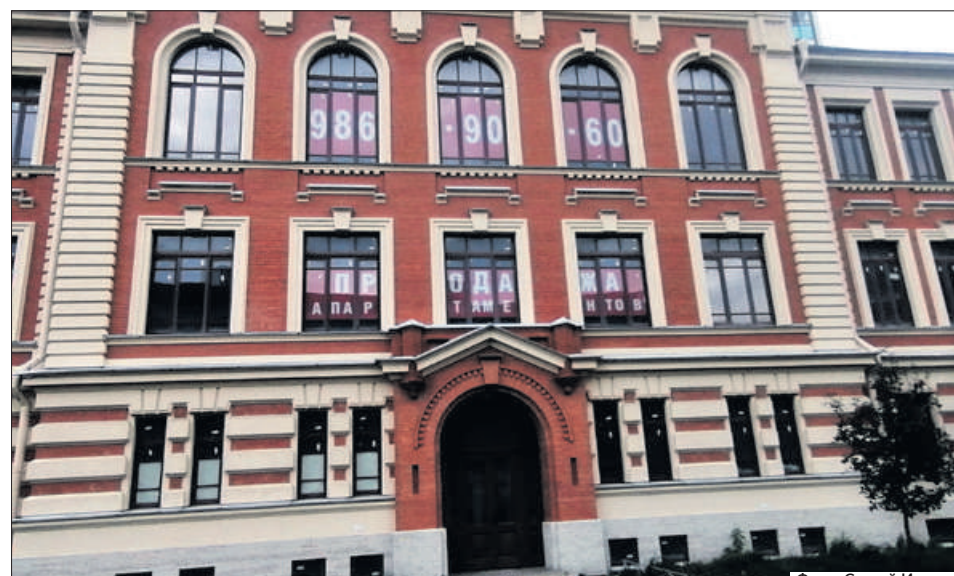
Реплика училищного дома 2023 г.