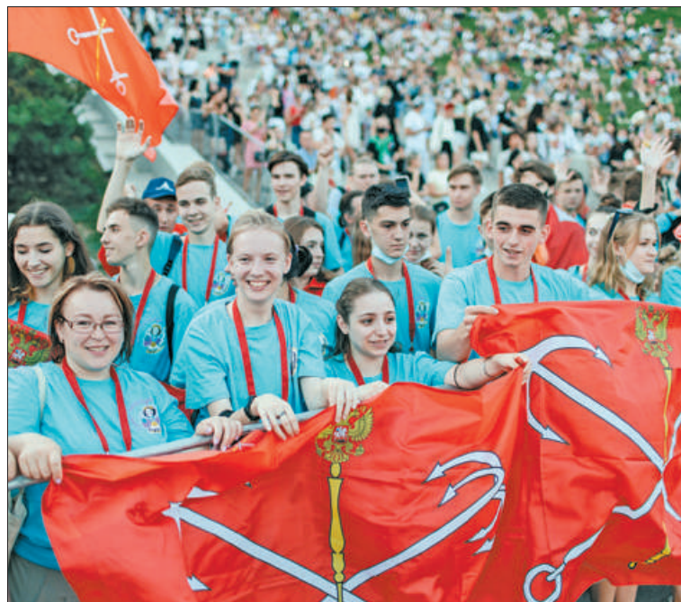
Школа № 691 вошла в топ-100 лучших школ рейтинга чемпионата «Молодые профессионалы».