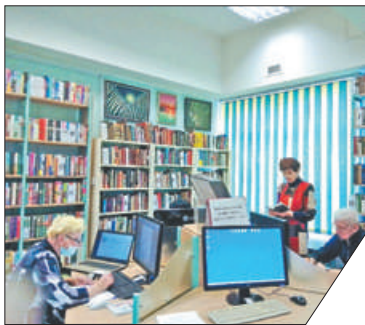
Адрес библиотеки: ул. Бабушкина, д. 135.

Отправить письмо по электронной почте, зарегистрироваться на портале «Госуслуги», записаться к врачу – всё это так просто для молодых и так сложно для их бабушек и дедушек. Библиотека № 4 на Троицком поле приглашает на бесплатные курсы компьютерной грамотности для людей пожилого возраста. Занятия проходят в группах по четыре человека два раза в неделю. Начало занятий по мере комплектования группы. Подробности – по телефону 362-44-97 или в группе «ВК»: https://vk.com/nevcbs4 .