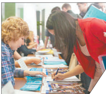
Адрес: м. «Проспект Большевиков», ул. Чудновского, д. 4, корп. 1. Тел. 576-10-75.

12 октября с 11.00 до 13.00 пройдёт ярмарка вакансий и учебных мест для людей с инвалидностью «Равные возможности». В программе ярмарки: вакансии электронного банка данных Комитета по труду и занятости, встречи с работодателями, представителями учебных заведений, общественных организаций инвалидов, творческие мастер-классы и благотворительная выставка-ярмарка работ клиентов Центра социальной реабилитации инвалидов и детей-инвалидов Невского района.