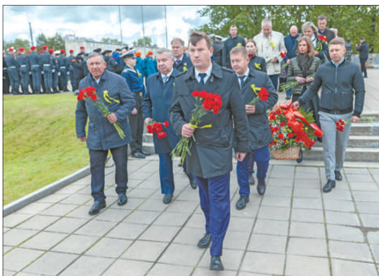
8 сентября на территории воинского кладбища «Журавли» состоялся торжественно-траурный церемониал, посвящённый Дню памяти жертв блокады Ленинграда. В мероприятии приняли участие около 400 человек.