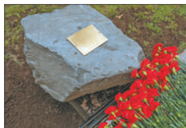
В Соляном переулке установили закладной камень будущего памятника блокадным медикам.