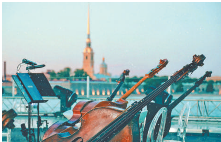
Концерт, посвящённый 80-й годовщине со дня первого исполнения в блокадном Ленинграде Седьмой симфонии Дмитрия Шостаковича, прозвучал на берегах Невы.