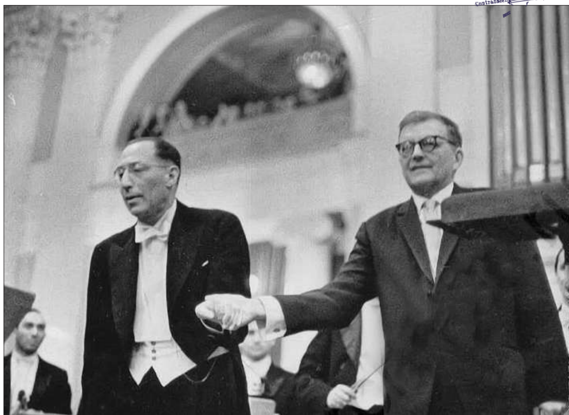
Композитор Д. Шостакович (справа) и дирижёр К. Элиасберг во время поклона по окончании исполнения 7-й Ленинградской симфонии в день 20-летия блокады города. 1964 год.

– Нет, нет, – остановила она меня, – я не хочу покупать вылизанные амстердамские цветы.