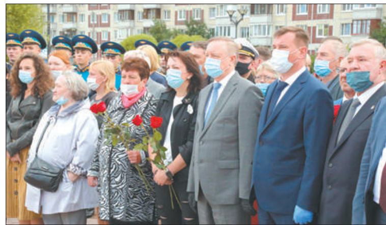
«В канун Дня Воздушно-десантных войск мы открываем бюсты наших ребят, наших героев», – сказал губернатор Александр Беглов.

«Девяносто десантников против двух тысяч боевиков. Они стояли насмерть и с честью выполнили свой воинский долг».