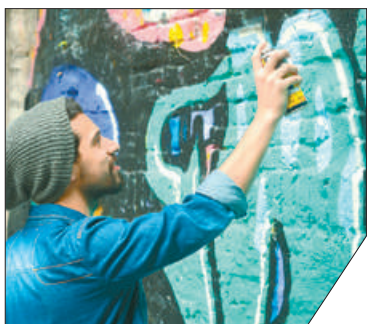
Петербургские граффити с изображением музыкантов, актёров и других известных личностей пользуются большой популярностью у жителей и гостей города.

Комитет по градостроительству и архитектуре предложит свои варианты для размещения творчества художников стрит-арта в городской среде, в том числе в центральных районах. Сейчас ведомство приступило к разработке специальных уличных конструкций. Их планируется размещать в городской среде как на постоянной, так и на временной основе – в местах организации массовых мероприятий. Заинтересованность в работах в стиле граффити выразили и представители рекламного бизнеса.