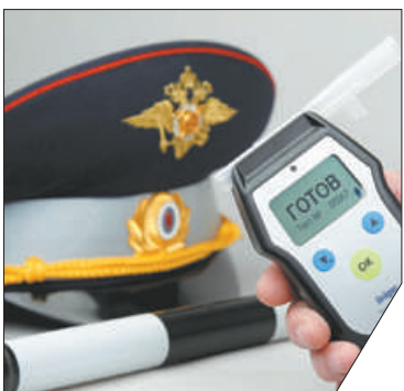
Дело Михаила Ефремова спровоцировало в обществе дискуссию о пьянстве за рулем.

В целях профилактики ДТП по вине водителей, управляющих транспортными средствами в состоянии алкогольного опьянения, отделом ГИБДД УМВД России по Невскому району Санкт-Петербурга до 21 августа будет проводиться профилактическая операция «Нетрезвый водитель». Сотрудники ДПС в заранее установленных местах будут останавливать транспортные средства и оценивать состояние каждого водителя.