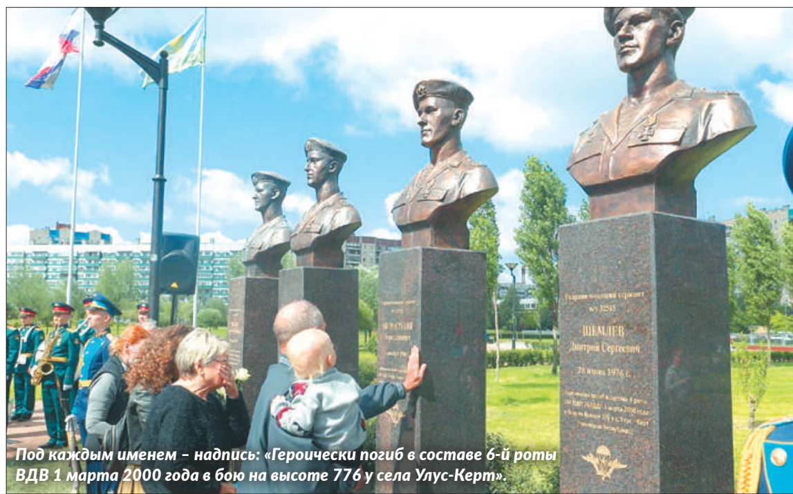
Под каждым именем – надпись: «Героически погиб в составе 6-й роты ВДВ 1 марта 2000 года в бою на высоте 776 у села Улус-Керт».

В парке Боевого Братства торжественно открыли бюсты воинов-десантников 6-й роты, погибших в бою в Аргунском ущелье в 2000 году.