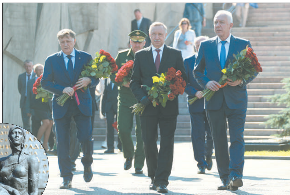
В день окончания Ленинградской битвы к Монументу героическим защитникам Ленинграда возложили венки и цветы.

градской битвы наши войска и жители города. Так, если вы пропустили трансляцию праздничного концерта из «Троицкого», то заходите на YouTube-канал культурного центра (легко найти по названию). Здесь вы также найдете несколько роликов, на которых режиссёр Антонина Гудкова читает Ольгу Берггольц. Серия «Доброе утро, люди!» – это пронзительные и трогательные фрагменты из книги «Дневные звёзды», дневника блокадной музыки.