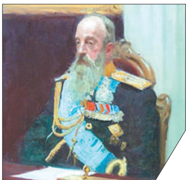
В виртуальном туре можно увидеть и знаменитое полотно «Торжественное заседание Государственного совета».

Празднуя 175-летие со дня рождения одного из самых известных русских художников, Русский музей приглашает всех любителей отечественного искусства совершить виртуальную прогулку по юбилейной выставке работ Ильи Репина, которая проходила с октября 2019 по март 2020 года в Корпусе Бенуа. Посетители портала «Виртуальный Русский музей» смогут свободно перемещаться по выставке и детально рассматривать отдельные экспонаты.