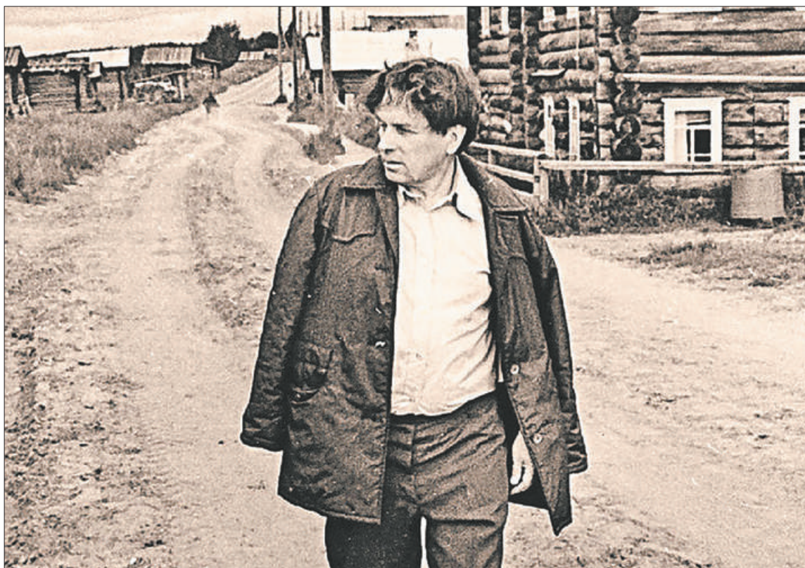
Фёдор Абрамов (1920–1983). Автор тетралогии «Братья и сёстры», повестей «Деревянные кони», «Пелагея», «Алька» и др., всего более 150 художественных и публицистических произведений.