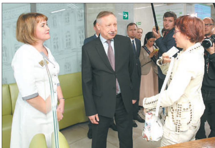
Внедрение новых форм и технологий работы в городской поликлинике № 87 уже позволило пациентам сократить время ожидания в регистратуре.

На бывшем Александровском заводе в XIX веке были построены первые отечественные пароходы, паровозы и подводные лодки, созданы архитектурные памятники, ставшие символами Петербурга: львы на Адмиралтейской набережной, колесница Славы на арке Главного штаба, квадрига на фронтоне Александринского театра, Нарвские и Московские триумфальные ворота и многое другое.