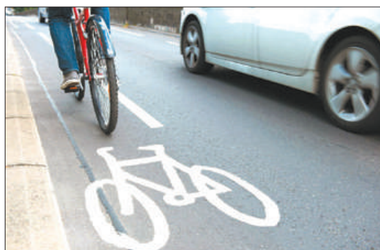
За шесть месяцев 2019 года на территории Невского района зарегистрировано 262 дорожно-транспортных происшествий, из них восемь с участием велосипедистов.