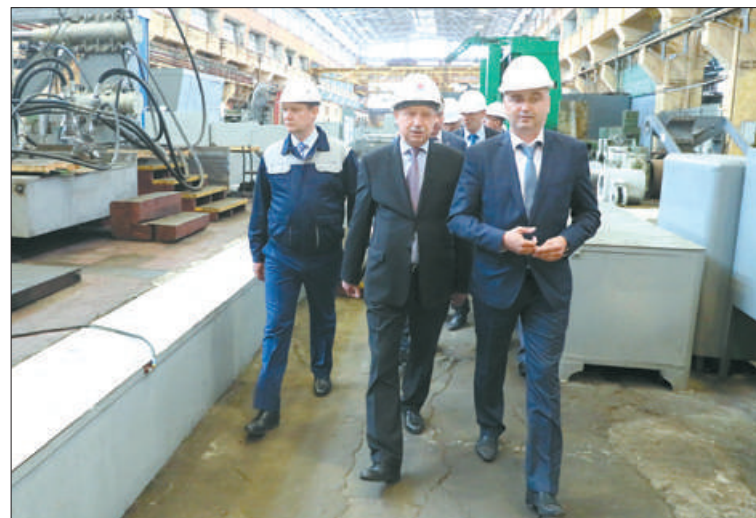
Временно исполняющий обязанности губернатора посетил «Пролетарский завод».

Сектор информации администрации Невского района