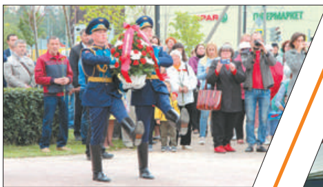
НЕВСКИЙ РАЙОН ОТМЕЧАЕТ ДЕНЬ ВДВ.