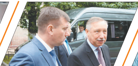
ВИЗИТ ВРИО ГУБЕРНАТОРА АЛЕКСАНДРА БЕГЛОВА В НЕВСКИЙ РАЙОН.