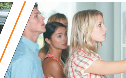
НЕ ХВАТИЛО БАЛЛА? МОЖЕТ, ЭТО ШАНС?