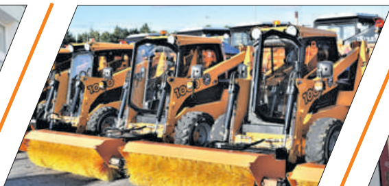
РЕФОРМА ЖКХ ПРОЙДЁТ ПРОВЕРКУ ЗИМОЙ