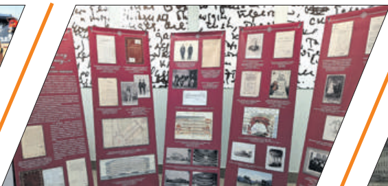
ОТ НОЧЛЕЖКИ ДО ТЕАТРА: АФИША МЕРОПРИЯТИЙ