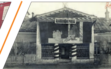
О БЫВШЕЙ МЫЗЕ С НАЗВАНИЕМ «КАПРИЗ»