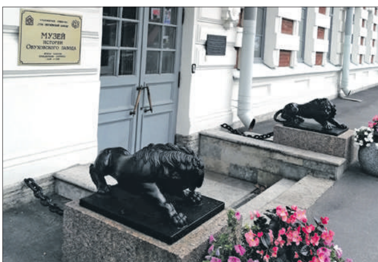
Статуи львов перед входом в Музей истории Обуховского завода.