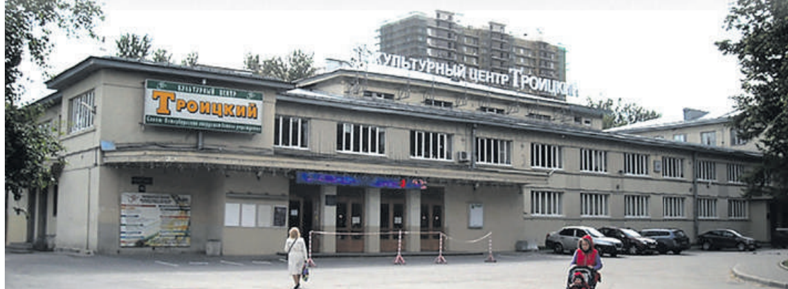
◆ Культурный центр «Троицкий», бывший Дворец культуры им. Ленина. 2017 г.

на месте дома А. В. Каменского. В заводской газете «Большевик» № 25 за 1929 г. была напечатана статья «Сегодня наш праздник (Открытие Дома культуры им. Ленина)» Ф. Вершинина: «...Огромный Дом культуры им. Ленина красуется перед нами. Зрительный зал и балкон вместят 7-го ноября 877 «большевиков», спортивный зал с душем, а дальше идут малый зал, раздевальня, кладовые, огромное фойе, вестибюль, буфет, столовая, кино-лекторский зал и т. д. Всех комнат не пересчитать. По широкой лестнице поднимаемся на второй этаж. Здесь широкие площадки для пляжа, где рабочий после трудового дня развалится и будет загорать на солнце. Таких площадок Дом культуры