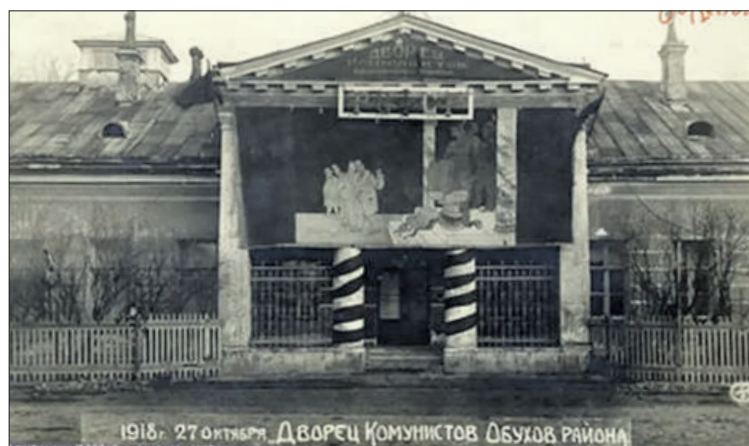
Дворец коммунистов Обуховского района 1927-1929 гг.