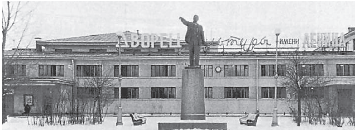
◆ Памятник В. И. Ленину перед Дворцом культуры имени Ленина 1968 г.

По воспоминаниям местных жителей, в том числе и моей мамы, Дом культуры строился