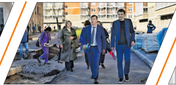
ШКОЛА И ДЕТСАД В УСТЬ-СЛАВЯНКЕ