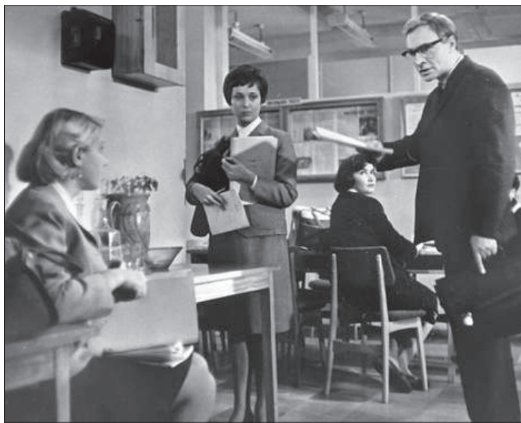
Талантливый педагог, принципиальный и требовательный Илья Семёнович в исполнении Вячеслава Тихонова в фильме «Доживём до понедельника» (1968).

Пунктуация в чатах не приветствуется по определению. Знаете ли вы, что если в процессе диалога в чате собеседник ставит точку в конце предложения, то это негласный знак того, что беседа окончена? Узнав об этом от дочери подруги, была удивлена. Безусловно, знать правила общения в чатах нужно. Но если вы будете грамотно и чётко доносить информацию, возможно, для кого-то это станет стимулом перечитать лишний раз своё сообщение перед отправкой.