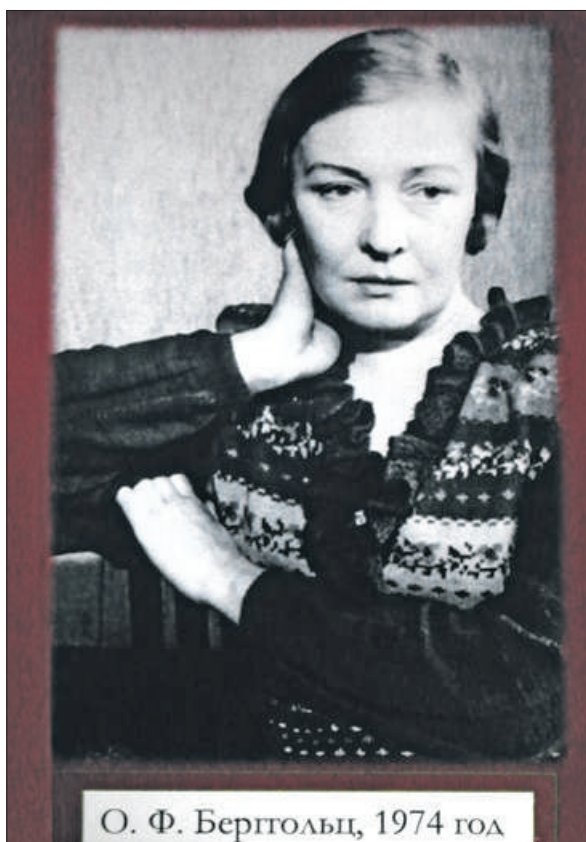
На открытии музея школы №337 присутствовала Ольга Берггольц – муза блокадного Ленинграда, чья судьба тесно связана с историей Невского района.

Этому способствует организация музейных марафонов, позволяющих познакомиться с исто-