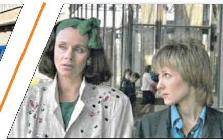
НЕВСКИЙ РАЙОН НА БОЛЬШОМ ЭКРАНЕ