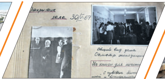
ВТОРОЕ ДЫХАНИЕ ШКОЛЬНЫХ МУЗЕЕВ