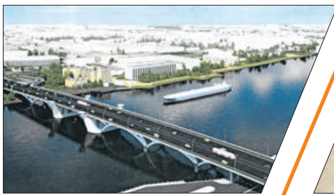
МОСТ НУЖЕН КАК ВОЗДУХ