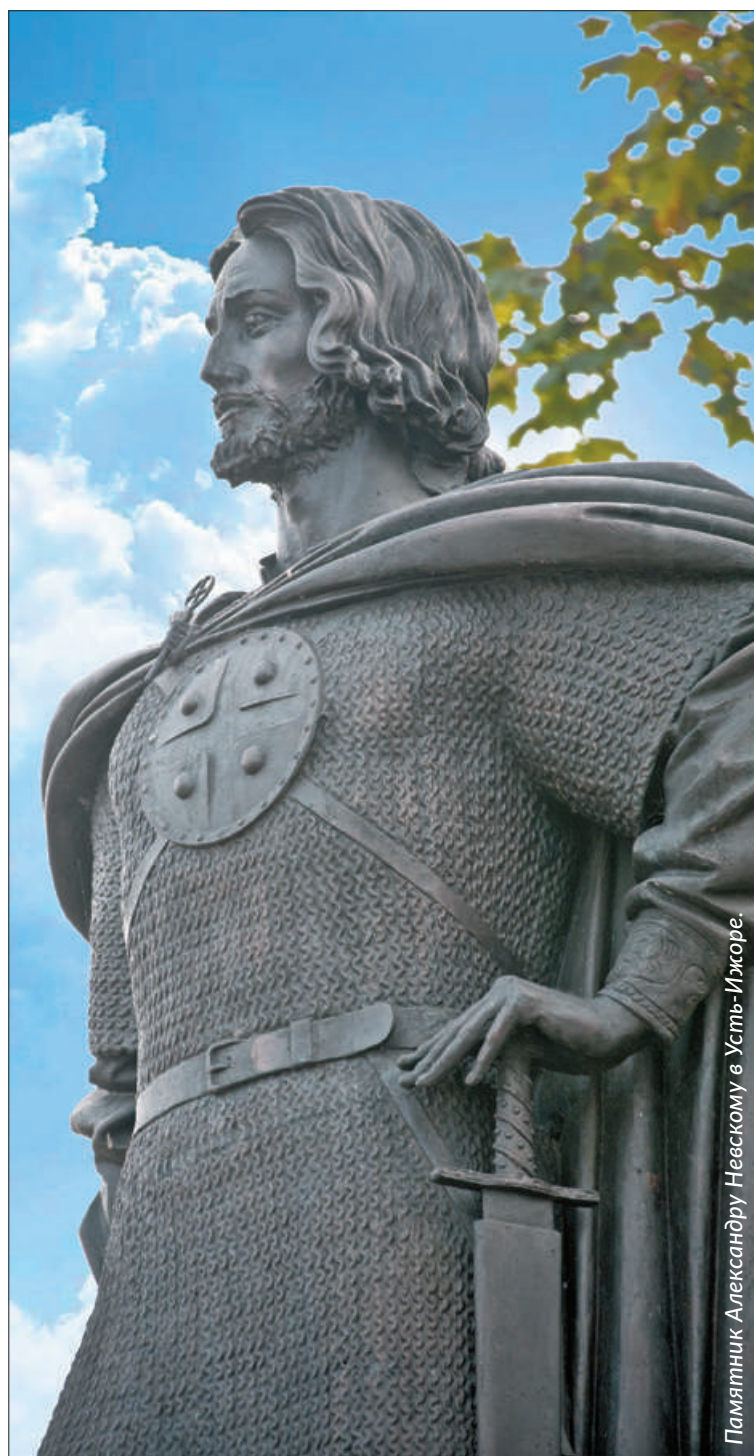
Памятник Александру Невскому в Усть-Ижоре.