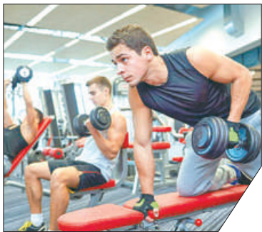
В спортивном центре смогут заниматься все желающие.

На рабочем совещании губернатора Александра Беглова с членами городского правительства был одобрен вопрос о предоставлении в аренду земельного участка в Невском районе под строительство спортивного центра. На Железнодорожном проспекте планируется возвести трёхэтажное здание с универсальным игровым залом, тренажёрным залом, раздевалками для команд, помещениями для тренеров.