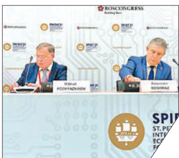
Соглашения предполагают долгосрочное сотрудничество сторон.

На Петербургском международном экономическом форуме концерн ВКО «Алмаз – Антей» заключил соглашения о сотрудничестве с Новгородской, Брянской областями, а также с Дальневосточным федеральным университетом. Соглашения касаются сферы цифровых технологий, реализации социальных программ, использования современных достижений телемедицины, создания новых рабочих мест и многого другого.