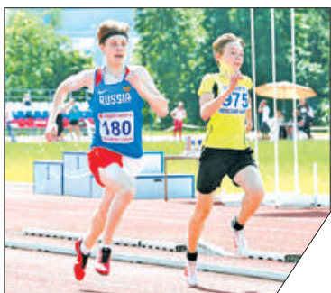
Воспитанники школы традиционно становятся призерами соревнований.

На стадионе спортивного комплекса «Приморец» прошли первенства Санкт-Петербурга по лёгкой атлетике. По итогам соревнований в возрастной категории до 16 лет спортсмены школы олимпийского резерва № 1 Невского района завоевали 5 золотых, 11 серебряных и 7 бронзовых медалей. В состязаниях юношей и девушек до 20 и до 23 лет – 8 золотых, 5 серебряных и 8 бронзовых медалей. Первенства Санкт-Петербурга по легкой атлетике проходят 2 раза в год. В них принимают участие спортсмены, представляющие 17 спортивных школ города.