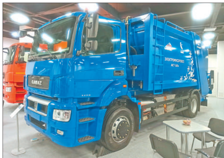
В прошлом году ПАО «КамАЗ» представил электрический мусоровоз под названием «Чистогор».

В будущем для «электриков» введут ещё больше льгот, а вот хозяев обычных машин, напротив, ждёт разного рода ограничения. Так, с 2025 года грузовикам и такси с бензиновыми и дизельными двигателями хотят запретить въезд в исторический центр Петербурга. Потом черёд