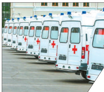
О необходимости увеличить приём абитуриентов в медицинские учреждения говорил губернатор Александр Беглов.

Комитет по здравоохранению завершил приём документов на целевое обучение врачей. Всего с кандидатами в 2020 году заключено 995 договоров на целевое обучение по программам высшего образования. В этом году планируется увеличить число бюджетных мест для подготовки среднего медицинского персонала в медицинских колледжах города, подведомственных Комитету по здравоохранению. В 2020 году будет принято 3025 студентов, что на 22% больше, чем в 2019 году.