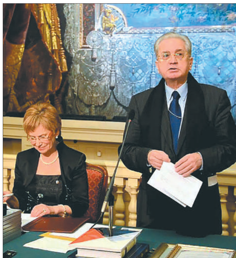
Президент клуба Михаил Пиотровский на Ассамблее Всемирного клуба петербуржцев рассказывает об издательских программах клуба.

– Я работала ответственным секретарем в Фонде возрождения Ленинграда, в 1991 году, в ночь с 6 на 7 января, в Мариинском театре мы участвовали в телемарафоне, чтобы собрать средства на