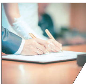
200 бракосочетаний регистрируются в Петербурге ежедневно.

В районных отделах ЗАГС и Дворцах бракосочетания Санкт-Петербурга возобновилась торжественная регистрация браков. Пока на церемонии могут присутствовать не более 10 человек, включая фотографа и видеооператора. Торжественная регистрация браков не проводилась ровно три месяца – с 28 марта по 28 июня. В этот период пары имели возможность перенести или отменить запланированную регистрацию.