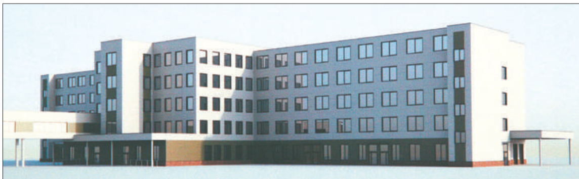
Высокотехнологичный стационар на 302 койки обещают построить в рекордно короткие сроки.

В пятиэтажном здании разместятся хирургическое и неврологическое отделения, лаборатория с самым современным оборудо-