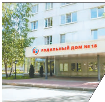
В родильном доме № 18 с начала пандемии работает круглосуточная «горячая линия» для беременных.

Открытие приурочили к Дню семьи, любви и верности. В дневном стационаре на 25 мест проведён ремонт и установлено новое оборудование – современные ультразвуковые аппараты и новые аппараты для регистрации сердечной деятельности плода. В отделении оборудовали палаты с телевизорами и смотровые комнаты. Дневной стационар сможет принимать в сутки до 70 женщин с различными патологиями беременности.