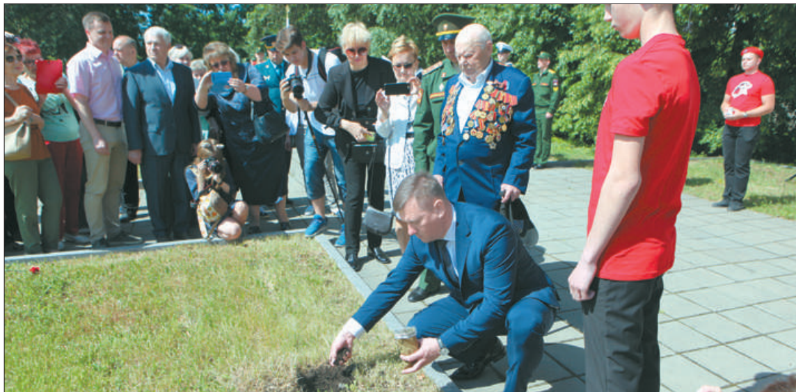
В торжественной обстановке был осуществлен забор земли с мемориала «Журавли» в «солдатские кيسеты».