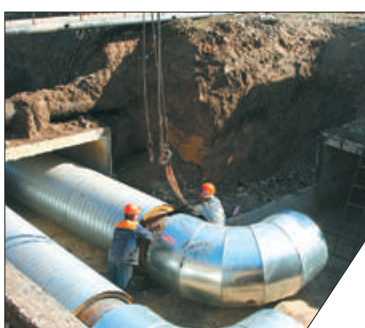
Минувшей зимой на этом трубопроводе произошло сразу три серьезных аварии.

Сейчас состояние самой длинной в городе тепломагистрали исследуют с помощью роботов, которые выявляют требующие замены участки труб. По завершении обследования начнется реконструкция «Пороховской», которая в будущем обеспечит бесперебойное теплоснабжение 485 зданий Невского и Красногвардейского районов. К отопительному сезону будет построена сеть-дублёр. Переключение с временного трубопровода на постоянную схему теплоснабжения и восстановление благоустройства территории намечено на 2021 год.