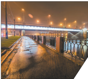
Наружное освещение Володарского моста было построено в 1993 году.

«Ленсвет» завершил реконструкцию наружного освещения Володарского моста и переходов инженерного сооружения в Невском районе. Работы выполнены за счёт средств бюджета города на месяц раньше отведенного срока. После реновации электропотребление сократилось в два раза, что обусловлено размещением энергоэффективных светодиодных светильников. Для бесперебойного электрообеспечения осветительной установки выполнена замена старых кабельных линий на новые протяженностью 4,3 км.