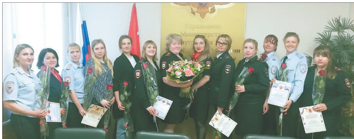
Отличившимся сотрудникам были вручены почётные грамоты и, конечно же, цветы.

Свою историю подразделения по делам несовершеннолетних ведут с мая 1935 года, когда Совет Народных Комиссаров СССР и ЦК ВКП (б) приняла постановление «О ликвидации детской безнадзорности и преступности».