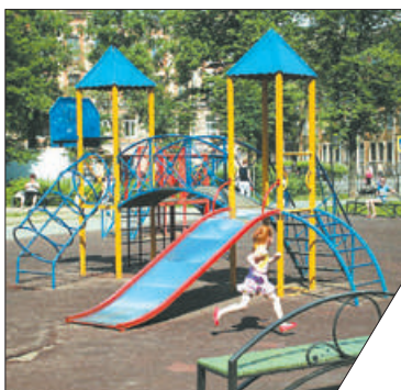
На территории МО Народный планируется дополнительно осветить 66 детских площадок.

В связи с обращениями жителей, поступающими в адрес администрации Невского района и муниципальных образований Невская застава и Народный, по вопросу недостаточного освещения внутриквартальной территории, администрацией подготовлены в Комитет по энергетике и инженерному обеспечению Санкт-Петербурга предложения для включения в адресные программы, финансируемые за счёт средств городского бюджета. Всего в предложение для включения в адресные программы по установке освещения внесены 83 объекта в Невском районе.