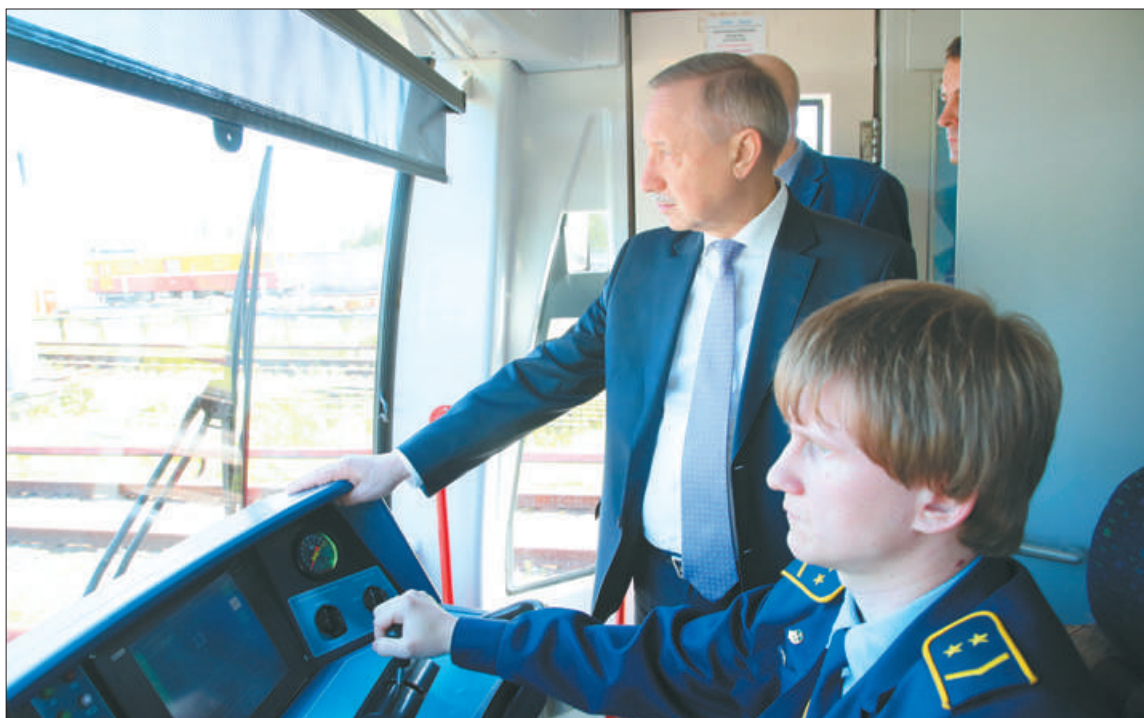
Александр Беглов оценил технические возможности и комфортабельность новых вагонов, назвав их более надежными, долговечными и экономичными.

Также глава города побеседовал с представителями трудового коллектива, ответил на их во-