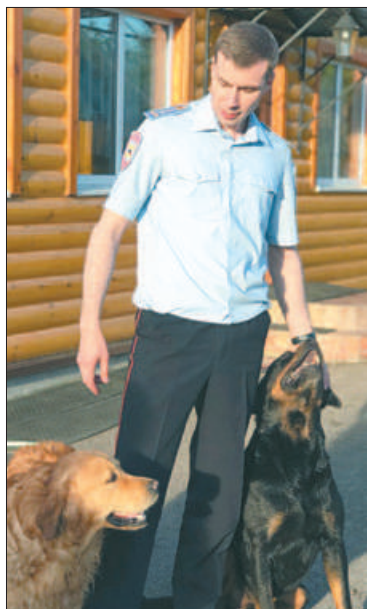
У Александра есть любимый питомец, который никогда не останется на улице.

Е. Р. ПЕТРОВА, старший лейтенант внутренней службы психолог ОМПО ОРЛС УМВД России по Невскому району г. СПб