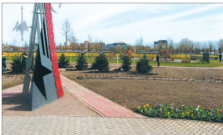
Территория, на которой разбит Брестский парк, принадлежит подворью Свято-Троицкого Александро-Свирского мужского монастыря.