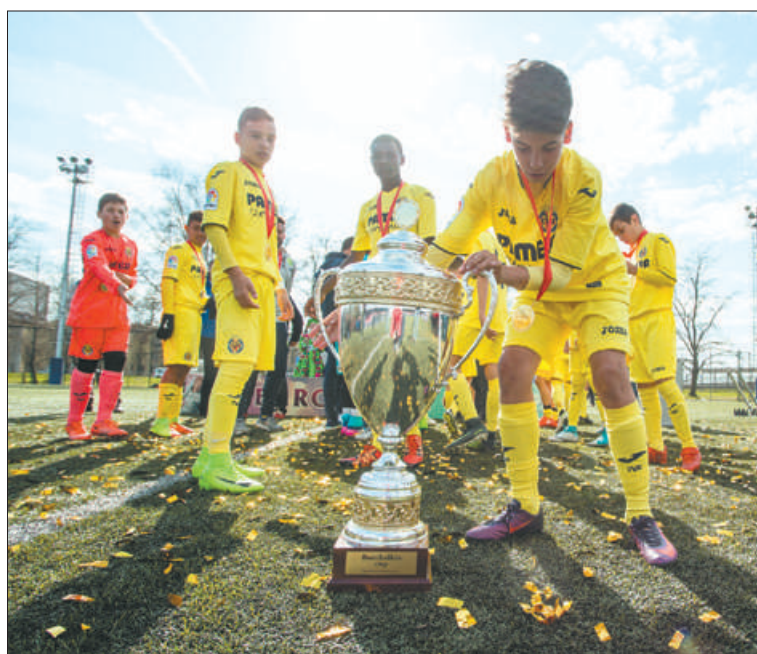
Кубок Льва Бурчалкина третий год подряд уезжает в Испанию. ФК «Вильярреал» снова подтвердил высокий уровень испанской футбольной школы.

Финальный день открылся игрой за 7-е место между командами МТК и ЦСКА. Победу в матче со счетом 2:1 одержали юные футболисты из Венгрии. За 5-е место боролись команда-хозяйка турнира «Алмаз-Антей» и команда «Краснодар». Победу по пенальти со счетом