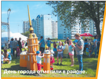
День города отметили в районе.