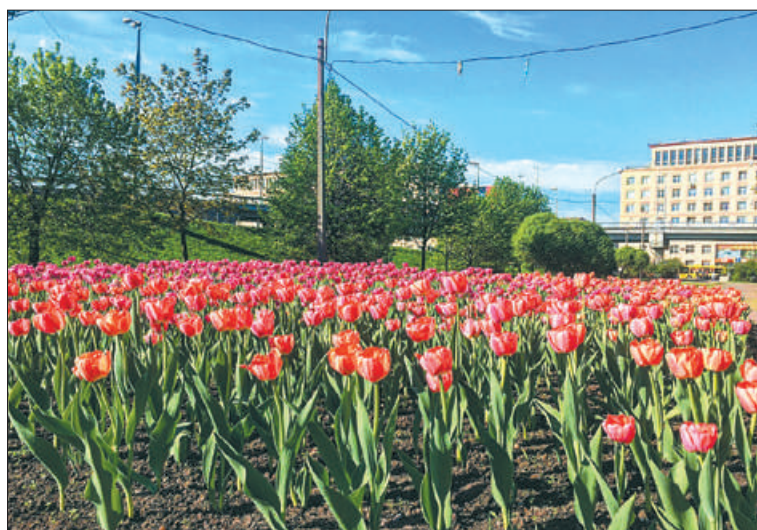
В этом году в Петербурге будет высажено более 8 миллионов цветов – почти на полмиллиона больше, чем в прошлом.

С наступлением теплой погоды в Деминском саду, расположенном на пересечении проспекта Обуховской Обороны и Мельничной улицы, были выполнены ра-