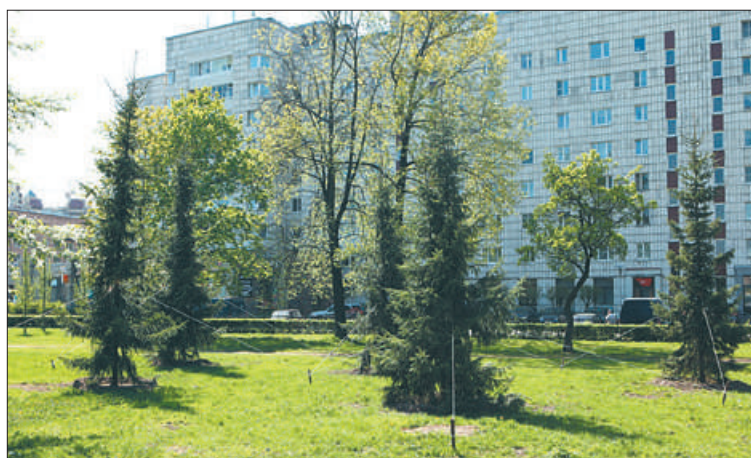
Специалисты садово-паркового предприятия «Невское» высадили 15 елей на пр. Обуховской Обороны, д. 199, на ул. Седова, д. 14 и у памятника морякам Полярных Конвоев.