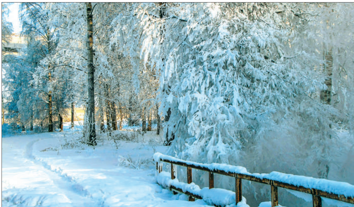
Зимой 2010 года под вантовым мостом, где речка Мурзинка, был потрясающий иней. Ветки под ним казались с руку толщиной!