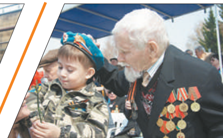
ПСИХОЛОГИЯ: МЕСЯЦ РАСЦВЕТА ДУШИ