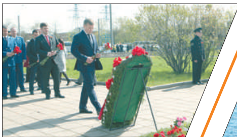
ПЕТЕРБУРГ ОТПРАЗДНОВАЛ ДЕНЬ ПОБЕДЫ.