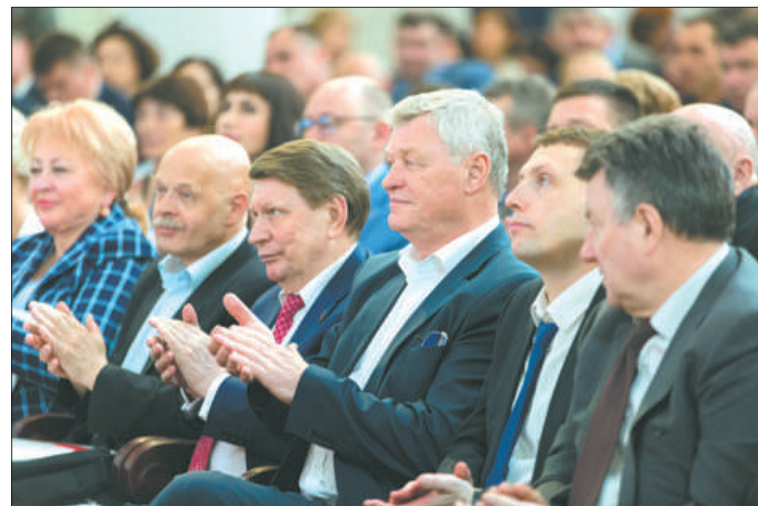
Представители общественных организаций отстаивают интересы граждан.

Также в зоне внимания Общественной палаты находятся вопросы экологической безопасности, общественный контроль за качеством ремонта дорог, решение вопросов организации медицинского обслуживания детей в школах, бюрократизации общего образования, вопросы ликвидации задолженностей по заработной плате петербуржцев и системного подхода к психологической и психотерапевтической помощи гражданам.