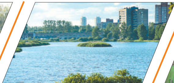
ИВАНОВСКИЙ КАРЬЕР: РЕКОНСТРУКЦИЯ НАЧАЛАСЬ.