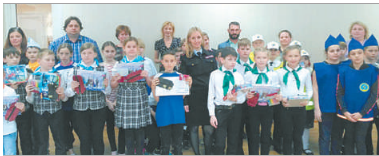
В 58 школах Невского района созданы отряды ЮИД – юных инспекторов движения.

Информация СПб центра информационной поддержки