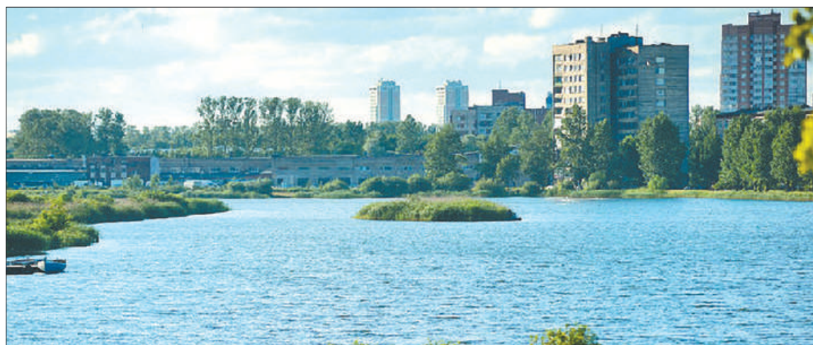
На объекте высадят 580 саженцев липы, дуба, ивы, березы и более 80 елей и лиственниц.

Пресс-служба Комитета по благоустройству