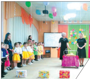
Детский сад № 30 дорожит своими традициями.