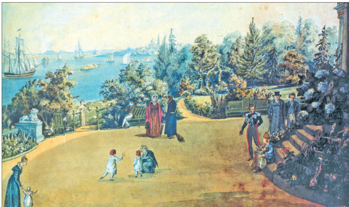
Семейный портрет на крыльце дома в Мурзинке.