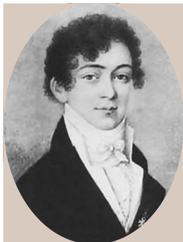
Дон Антонио Мареско Доннорсо дюк де Серра-Каприола (1750–1822).