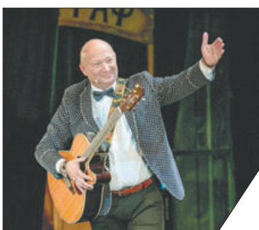
Ряд театров планируют сделать сурдоперевод видеозаписей спектаклей.

В Петербурге всё больше становится театров, которые планируют показывать спектакли с сурдопереводом. «Мы поставили задачу развивать Петербург как комфортный город для всех жителей, независимо от особенностей здоровья», – сказал Александр Беглов. На регулярной основе спектакли с переводом на жестовый язык уже показывает Театр эстрады им. А. Райкина, в апреле к проекту присоединился «Особняк. Театр».