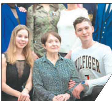
Желаем нашим спортсменам здоровья и новых побед!

В спортивном комплексе «Ледовая арена» прошло награждение и чествование победителей и призёров чемпионата мира по фигурному катанию-2021 в парном катании. Почётными грамотами и памятными призами наградили Анастасию Мишину и Александра Галлямова, Александру Бойкову и Дмитрия Козловского. Спортсмены занимаются в Спортивном клубе фигурного катания Тамары Москвиной в Невском районе. Администрация района присоединяется к поздравлениям.