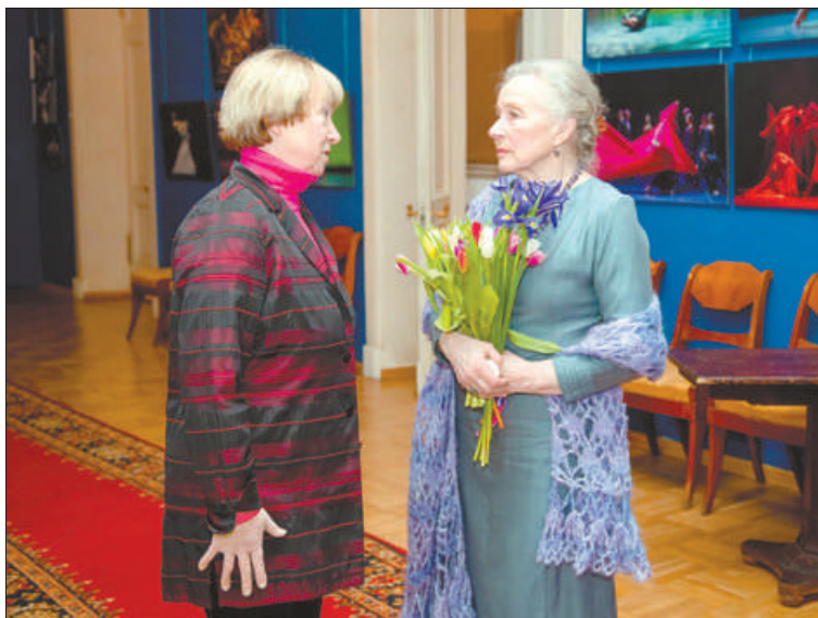
С народной артисткой России Ларисой Малеванной.