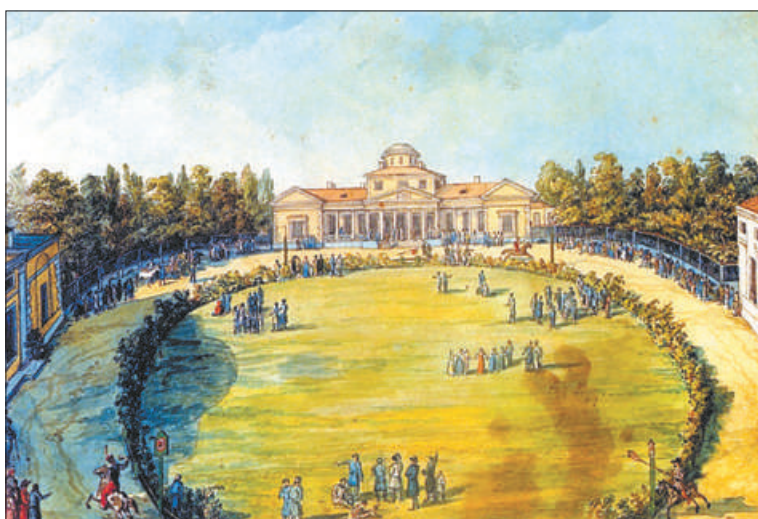
Курдонер в Мурзинке.

тился о том, чтобы можно было иногда взглянуть на милые сердцу места, где прошли его детство и юность. Так теперь мы берём с собой фотографии, а он взял собственные рисунки. Они не слишком искусны, но вполне «информативны» и передают его отношение к тому, что он изображал.