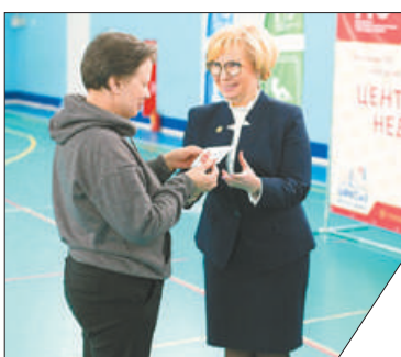
Число желающих сдать нормы ГТО постоянно растёт.

Центр тестирования ГТО Невского района по итогам 2020 года занял второе место в рейтинге ГТО среди 18 районов Санкт-Петербурга. Хотите проверить себя? Получайте медицинский допуск об отсутствии противопоказаний к занятиям спортом, регистрируйтесь на сайте ГТО и приходите на выполнение нормативов. Информацию можно уточнить по телефону 329-05-19 или в группе ВФСК ГТО Невского района https://vk.com/gto.nevskiy .