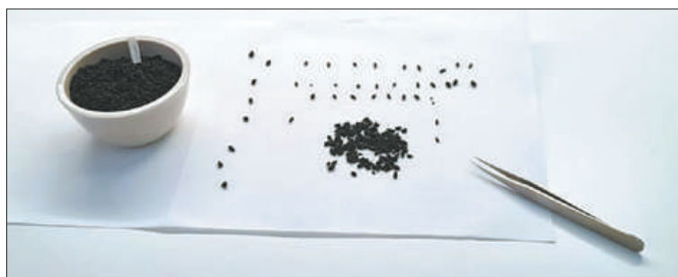
Этому зерну 800 лет, и оно не сгнило по счастливой случайности: находилось на глубине 70 см, кислород к нему не поступал.