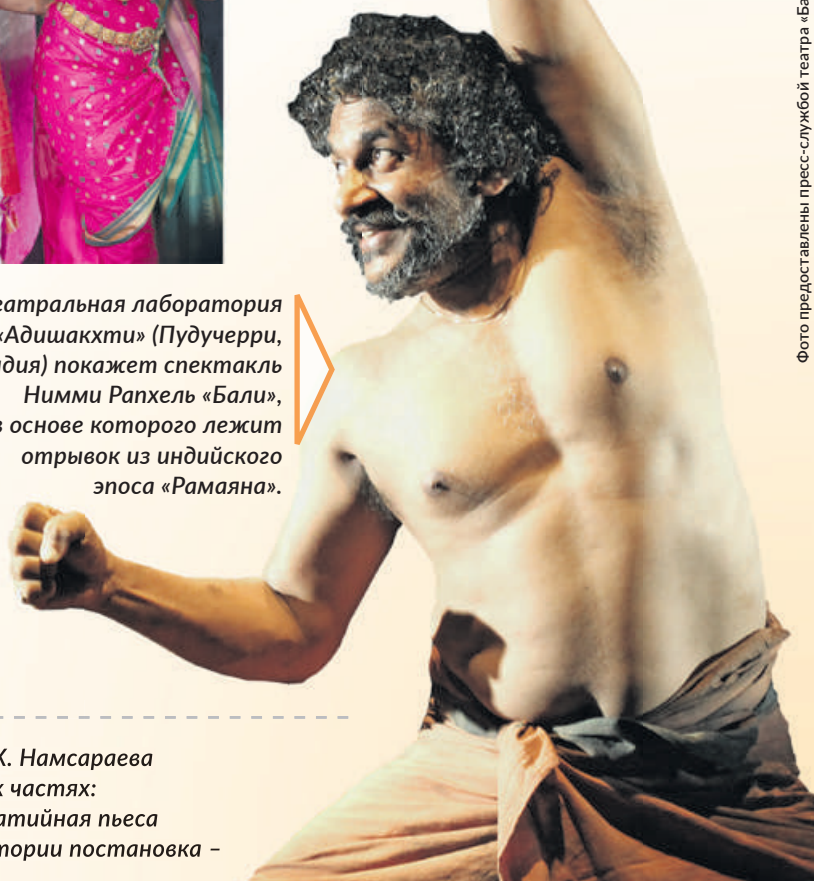
Театральная лаборатория «Адишакhti» (Пудучерри, Индия) покажет спектакль Нимми Рапхель «Бали», в основе которого лежит отрывок из индийского эпоса «Рамаяна».