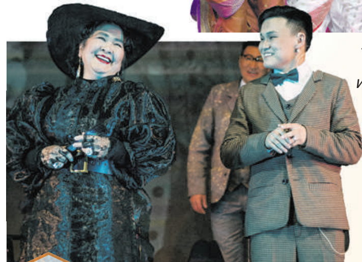
Государственный бурятский академический театр драмы им. Х. Намсараева (Улан-Удэ) представит спектакль Олега Юмова «Лес/Ой» в двух частях: «Лес. Начало/Ой» и «Лес. Продолжение/Ой. Тугэсхэл». Хрестоматийная пьеса Островского зазвучит совершенно по-новому. Это первая в истории постановка – языковой микс на бурятском, русском и монгольском языках.