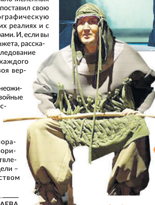
«В чаще». Государственный театр коренных малочисленных народов Севера.

“ Фестиваль пройдёт с 6 по 18 октября. Время летит быстро, поэтому лучше запланировать свои балтийско-восточные вечера заранее.