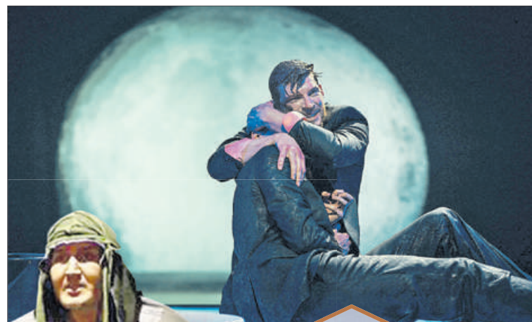
Спектакль «Стражи Тадж-Махала» режиссера Алексея Золотовицкого привезет на фестиваль Московский драматический театр имени А.С. Пушкина.