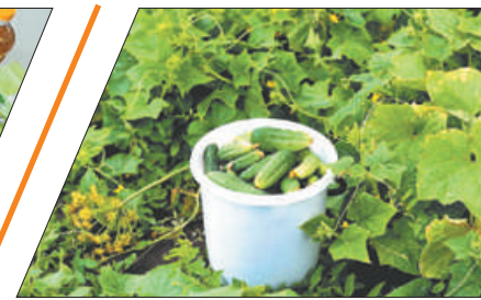
О ПОДДЕРЖКЕ САДОВОДОВ И ОГОРОДНИКОВ