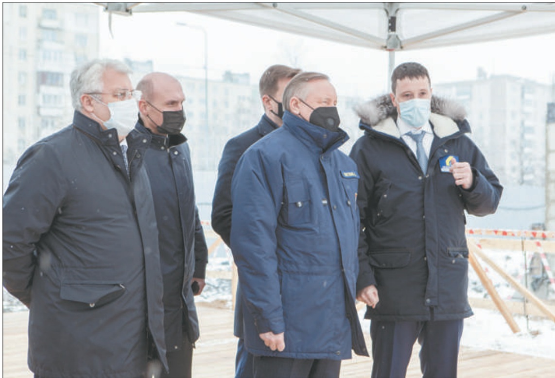
Александр Беглов подчеркнул, что город пошёл правильным путём, не застроив территории, прилегающие к стационарам. Это позволило возводить новый корпус Александровской больницы рядом с существующими зданиями. С госпиталем их соединят комфортным и тёплым переходом.

В обычное время в корпусе трансформера будет работать современный региональный сосудистый центр – стационар на 335 коек, 40 из которых в интенсивной терапии.