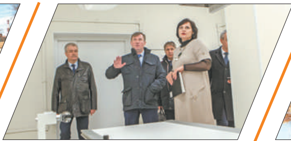
ГОТОВИМСЯ К ПРИЁМУ ПАЦИЕНТОВ