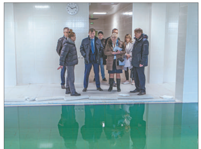
Именно водолечебница является «жемчужиной» учреждения, отметили представители поликлиники для взрослых.