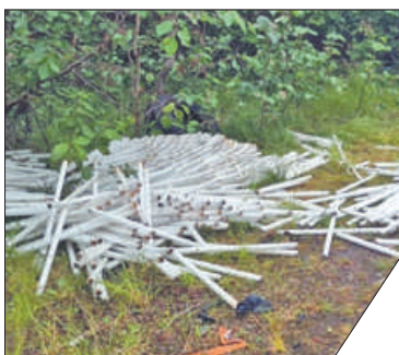
На экологическом портале города infoeco.ru можно узнать адреса экокунктов и экотерминалов.

Аварийная экологическая служба СПб ГУП «Экострой» вывезла из Невского района Петербурга 780 целых бесхозных люминесцентных ламп. Как сообщает пресс-служба «Экостроя», лампы нашли по адресу: улица Дудко, д. 31, корп. 2. Напоминаем, что вы можете воспользоваться городской системой приёма опасных отходов, для этого имеются экокункты и экотерминалы.