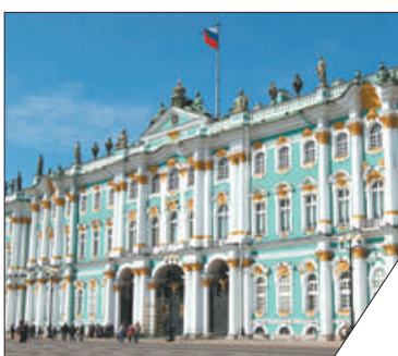
В рамках программы давно действует бесплатное посещение Главного штаба и льготная цена в Главный музейный комплекс.

Продолжая реализацию своих социальных программ, Эрмитаж вновь расширяет список категорий посетителей, которым предоставляет право бесплатного посещения музея или возможность покупки билетов по сниженной стоимости. Теперь это ещё и многодетные семьи, аспиранты, адъюнкты, интерны, военнослужащие, проходящие военную службу по призыву; ветераны боевых действий. Также с 19 апреля пенсионеры, студенты, курсанты, сотрудники музеев России и многие другие могут посещать Музей ИФЗ бесплатно!