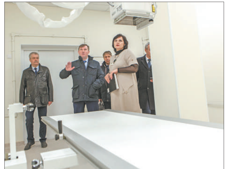
Приём пациентов в новых медицинских учреждениях на Союзном проспекте планируется начать в четвёртом квартале этого года.