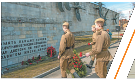
СТАРТ ВСЕРОССИЙСКОЙ АКЦИИ «ВАХТА ПАМЯТИ»