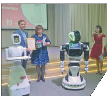
Поздравляем победителей чемпионата на кубок губернатора Санкт-Петербурга по робототехнике.

В Малоохтинском колледже состоялась церемония подведения итогов и награждения победителей чемпионата на Кубок губернатора Санкт-Петербурга по робототехнике. Чемпионат был организован Комитетом по образованию совместно с Малоохтинским колледжем по поручению губернатора Александра Беглова. По результатам выступления всех участников чемпионата команда школы № 334 завоевала Кубок губернатора Санкт-Петербурга по робототехнике-2022.