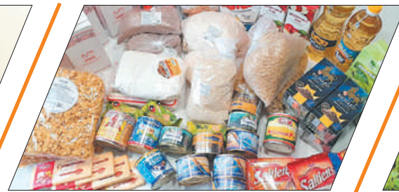
ВСЕМ МИРОМ ПОМОЖЕМ МАРИУПОЛЮ