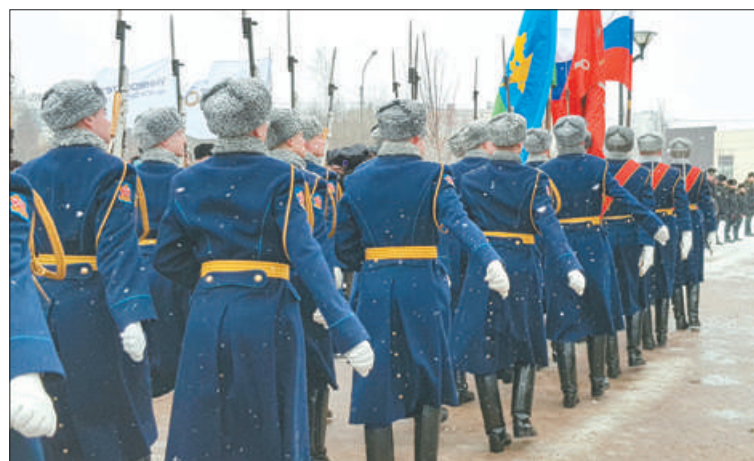
Отдавая дань подвигу десантников, торжественным маршем прошла рота почётного караула Западного военного округа.