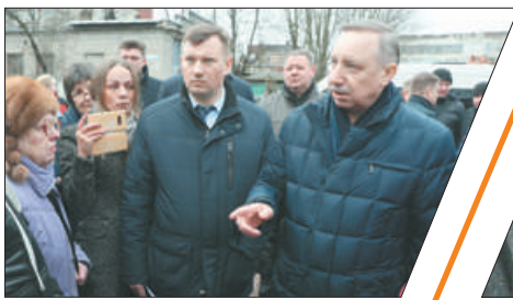
ГУБЕРНАТОР АЛЕКСАНДР БЕГЛОВ В НЕВСКОМ РАЙОНЕ с.2-3