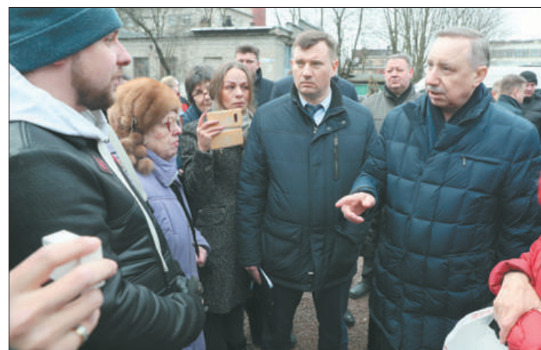
К Александру Беглову обратились жители с просьбой о благоустройстве дворовых территорий.