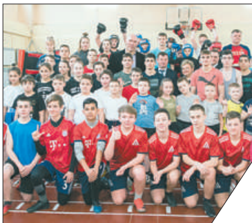
Клуб «ЛИДЕР» сегодня является одним из самых востребованных в Санкт-Петербурге.