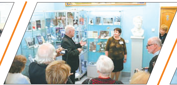
В БИБЛИОТЕКЕ ИМЕНИ Ф. АБРАМОВА ОТКРЫЛИ БЮСТ ПИСАТЕЛЯ с.5