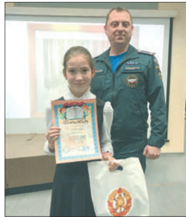
Победителям конкурса вручены памятные призы и грамоты.

Мероприятие организовано при взаимодействии отдела образования администрации Невского района с Отделом надзорной деятельности и профилактической работы Невского района, Пожарно-спасательным отрядом Невского района и Невским отделением Всероссийского добровольного пожарного общества. Главная цель конкурса – формирование у подрастающего поколения осознанного и ответственного отношения к личной