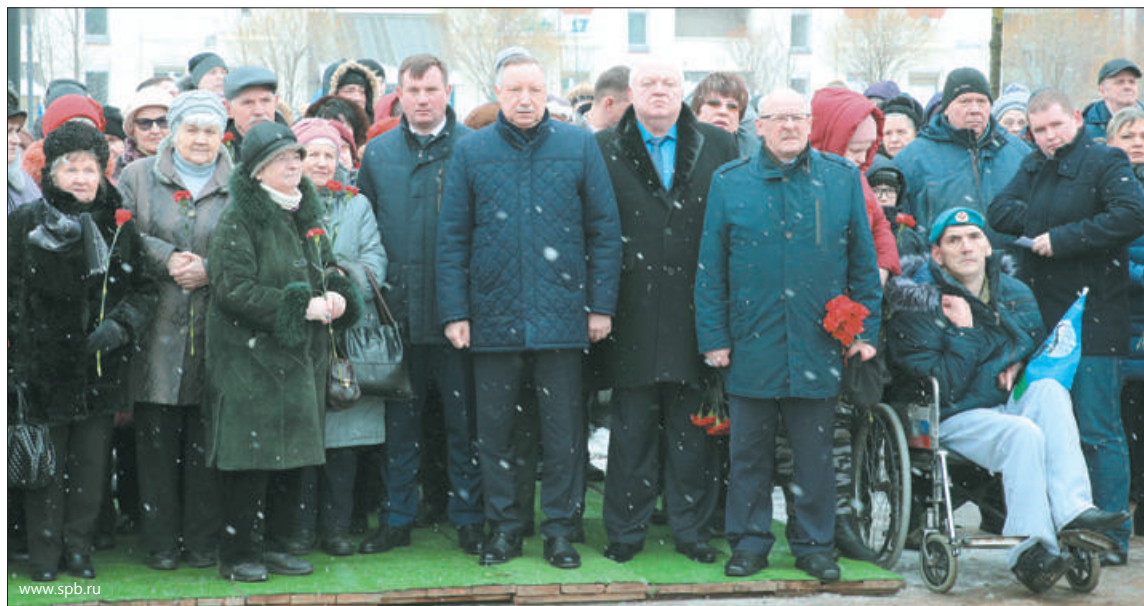
«Воины 6-й роты Псковской воздушно-десантной дивизии являются достойными наследниками наших отцов и дедов, победивших фашизм и исполнивших свой долг в Афганистане», – сказал губернатор Петербурга Александр Беглов.

В Электромеханическом техникуме железнодорожного транс-