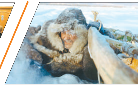
«ЕСЛИ У ЧЕЛОВЕКА ЕСТЬ СИЛА ВОЛИ, ОН МОЖЕТ ВСЁ» - ЯЦЕК ПАЛКЕВИЧ с.7