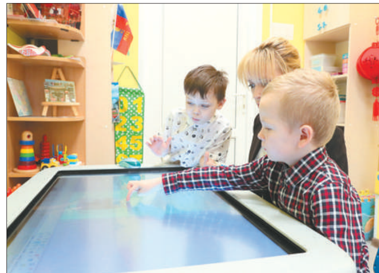
В 2017 году сад занял первое место в номинации «Лучший инклюзивный детский сад».

В прошлом году в Петербурге очередь в детские сады для детей до трёх лет снизилась вдвое. Только в Невском районе дополнительно появилось 900 мест в детских садах. В этом году в районе планируется завершить строительство трёх школ (на 3300 мест) и двух детских садов (на 250 мест).