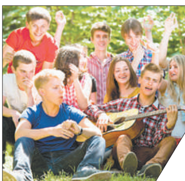
Лучшим студенческим отрядам будет вручаться Почётное знамя губернатора Санкт-Петербурга.

Александр Беглов утвердил официальную форму поощрения городских студенческих отрядов – Почётное знамя губернатора Санкт-Петербурга. Награда будет вручаться лучшему отряду 17 февраля, в День российских студенческих отрядов. По поручению губернатора, в честь 60-летия движения студенческих отрядов, для штаба было выделено помещение, где сейчас идёт ремонт. Александр Беглов поручил завершить все работы и открыть штаб к началу трудового сезона.