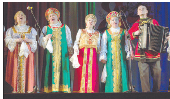
После завершения торжественной части работников ПАО «Пролетарский завод» ожидал праздничный концерт.

на фотовыставке, которая называется «Петербургская мозаика».