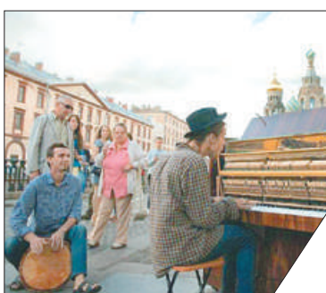
Количество участников творческого коллектива не должно превышать 10 человек.

Уличные музыканты на Невском, Большой Конюшенной, Дворцовой давно стали неотъемлемой частью петербургской атмосферы. Узаконить их выступления и определить правила, по которым они смогут работать, призван проект закона, внесённый на рассмотрение городского парламента. В частности, законопроектом предлагается ограничить продолжительность уличного выступления максимум шестью часами в день.