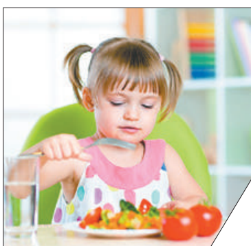
Подробная информация о конкурсе «Лучшее – детям» на сайте www.rosdet.ru .

Конкурс является системой добровольной сертификации продукции детского ассортимента, услуг для детей и подростков по категории «Качество». Знак качества «Лучшее – детям» информирует потребителя о том, что маркированная этим знаком продукция или услуга не только безопасна, но и качественна. В 2020 году конкурсная экспертиза продукции, выдвинутой на соискание знака качества «Лучшее – детям», будет проходить с 15 января по 15 ноября.