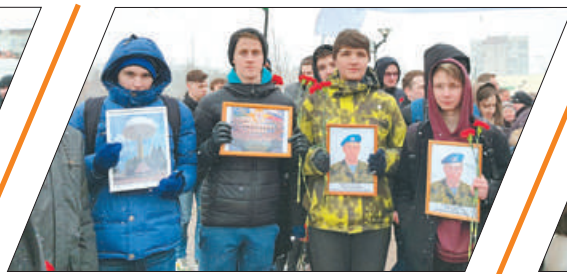
В ПАРКЕ БОЕВОГО БРАТСТВА - ДЕНЬ ПАМЯТИ 6-Й РОТЫ ПСКОВСКОЙ ДИВИЗИИ с.4