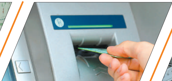
КТО ЗАЩИТИТ ВАШИ ФИНАНСОВЫЕ ПРАВА?