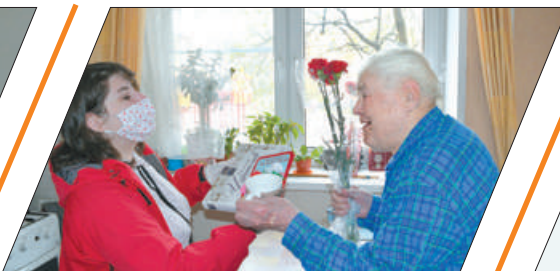
СОЦИАЛЬНЫЙ РАБОТНИК – ПОМОЩНИК И КОМПАНИОН