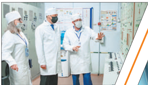
«МЕЛЬНИЦА КИРОВА» НАКОРМИТ ГОРОД