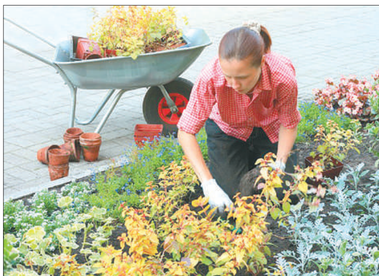
Работы по высадке первых цветов планируется начать в конце апреля.