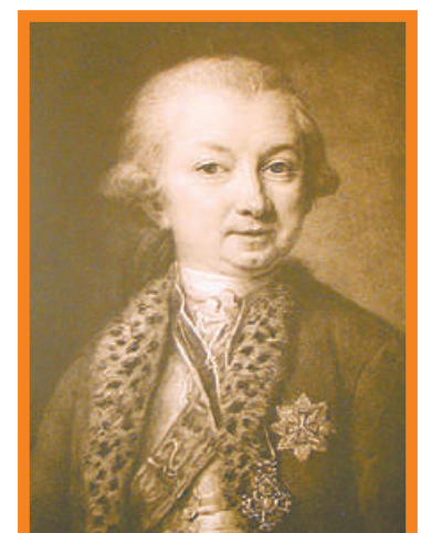
Князь Александр Алексеевич Вяземский.