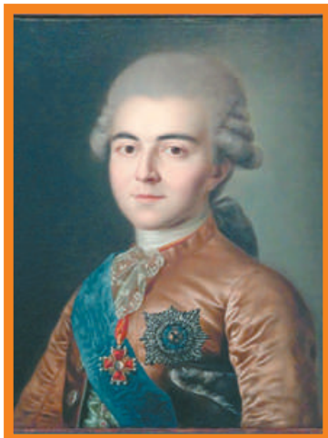
Граф Алексей Григорьевич Разумовский в молодости.