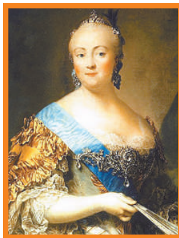
Императрица Екатерина II.

Мурзинка стала местом исторической встречи Екатерины II, в самом начале её царствования, с секретным шлиссельбургским узником Иваном Антоновичем. Дело в том, что 28 июня 1762 г., когда Екатерина Алексеевна была провозглашена императрицей, ещё были живы два других государя, признанных императорами раньше неё. Это были супруг Екатерины Пётр III Федорович и предшественник императрицы Елизаветы Петровны Иван VI Антонович, венчанный на царство в младенческом возрасте. Пётр III