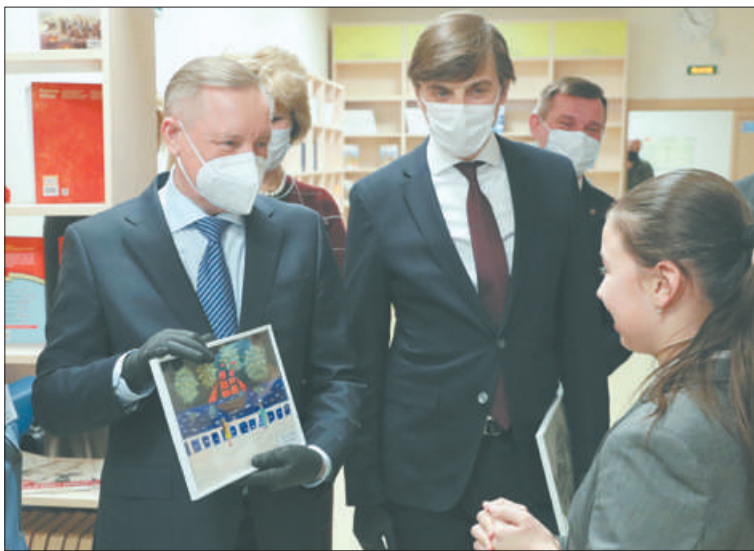
Школьники не отпустили гостей без подарков – министру вручили изображение города будущего, а Александру Беглову – картину «Алые паруса».

«Бассейны – дорогое удовольствие. Но город берёт на себя эти повышенные затраты и принципиально будет строить детские сады и школы с бассейнами», – подчеркнул Александр Беглов.