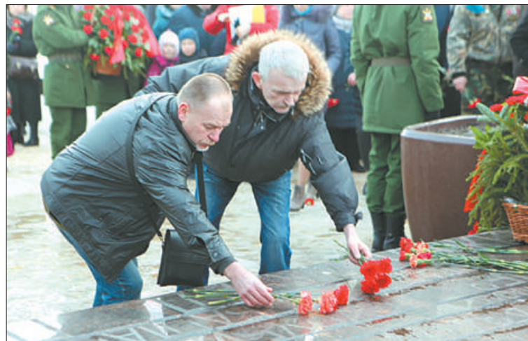
15 февраля в парке Боевого братства Невского района состоялась траурно-торжественная церемония, посвящённая 30-летию вывода советских войск из Афганистана. Участники мероприятия почтили память погибших воинов минутой молчания и возложили к памятнику венки и цветы.