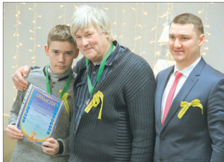
Победители представляют подростково-молодёжный центр «Невский» на межрайонном турнире.