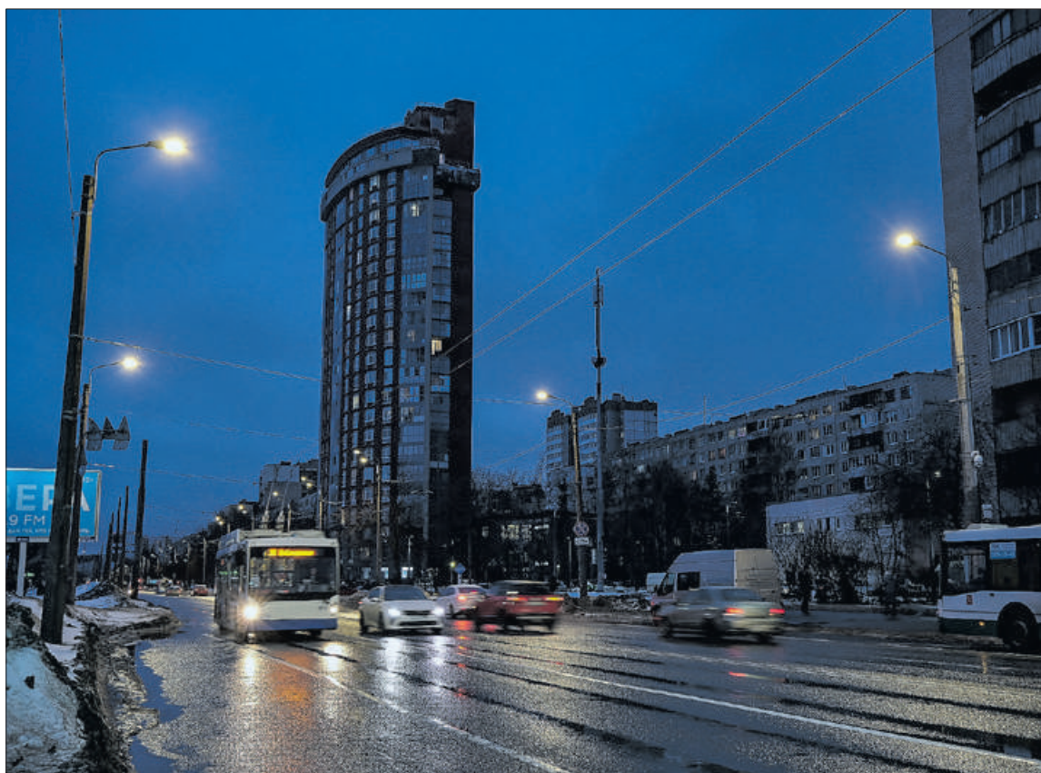
На улице Подвойского завершилась модернизация системы освещения.

К реконструкции в квартале приступили в конце 2022 года. Устаревшие сети заменили современными гибкими трубами,