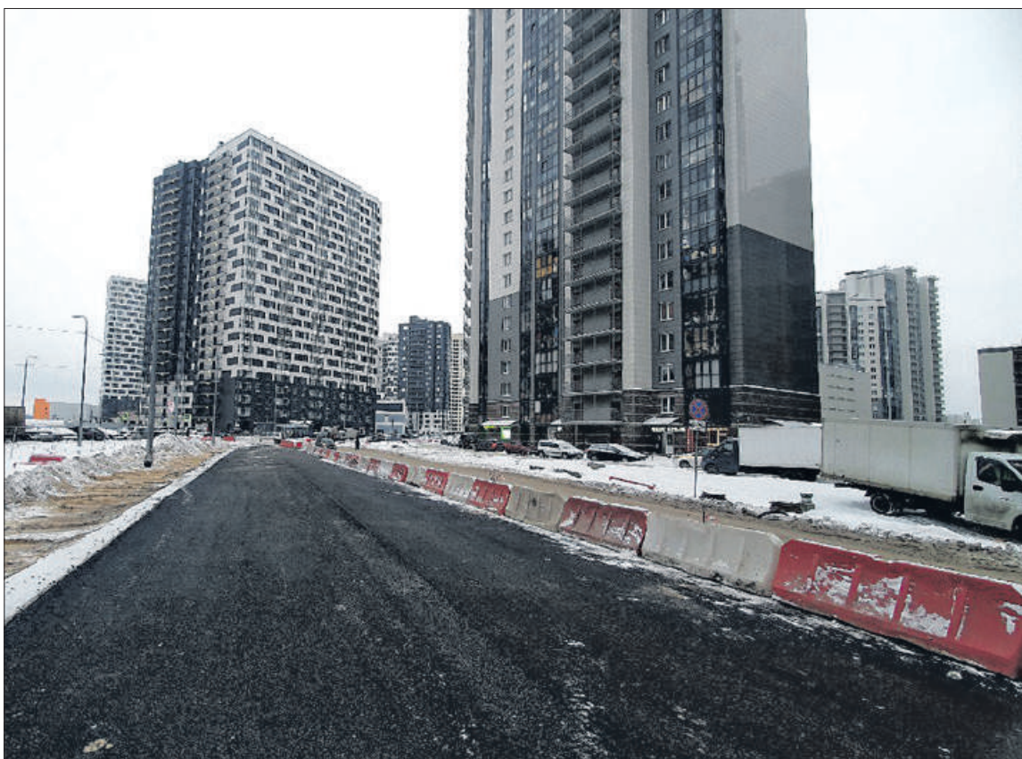
Продолжается строительство Русановской улицы.