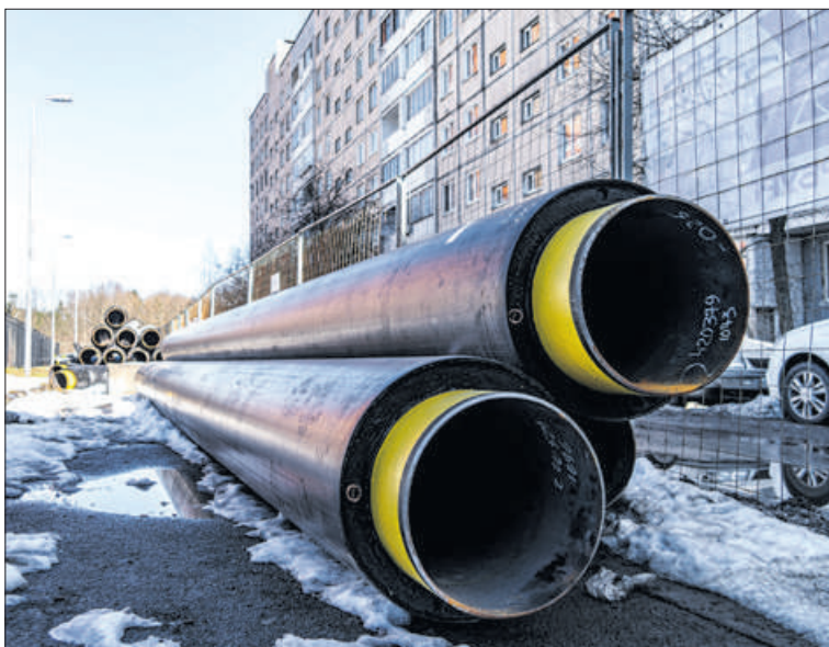
Почти 20 тысяч жителей Троицкого поля получили бесперебойное теплоснабжение.

а также бесшовными стальными трубопроводами с датчиками контроля целостности изоляции. На период реконструкции было смонтировано более 7,6 километра временной тепловой сети.