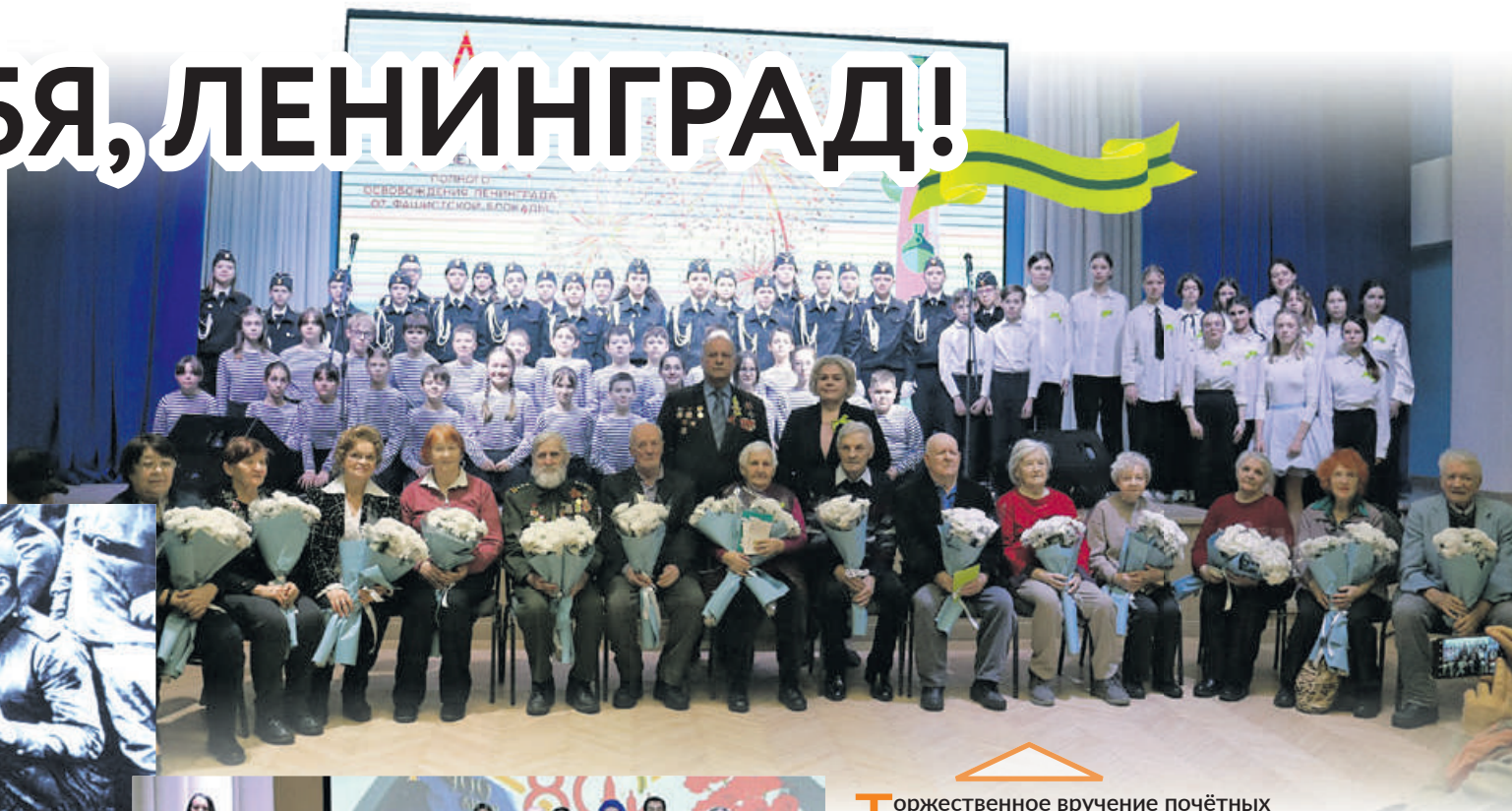
Торжественное вручение почётных знаков в школе № 557.

В школах Невского района продолжается вручение почётных знаков «В честь 80-летия полного освобождения Ленинграда от фашистской блокады».