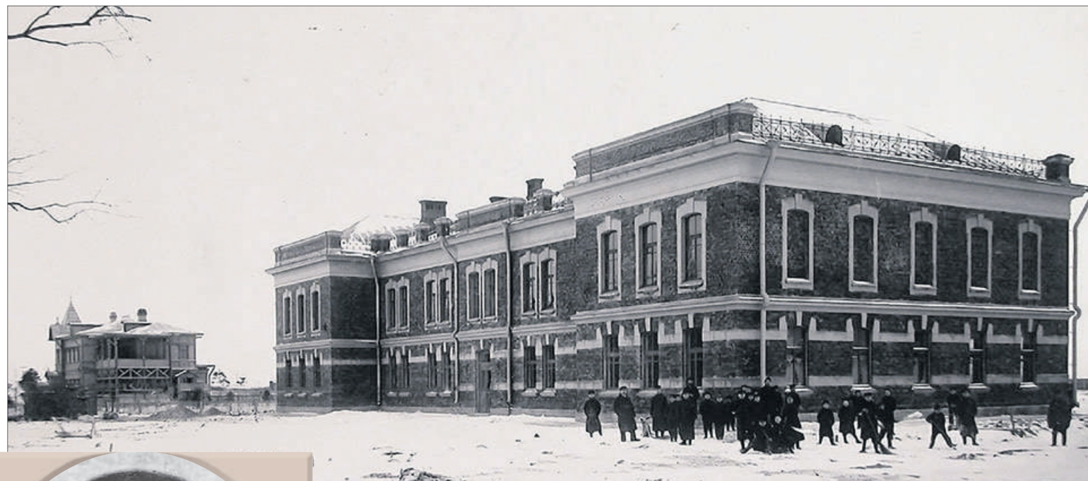
Общий вид приюта глухонемых в Мурзинке. Фотография ателье К. Буллы 1900-е гг. На заднем плане видно здание фермы.

Попечительство о глухонемых построило в Мурзинке целый