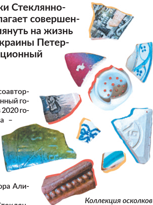
Коллекция осколков материальной культуры.

В основу проекта «Стекло-городок» легла коллекция осколков, найденных на территории селения Стеклозавода. Сейчас она насчитывает несколько тысяч осколков преимущественно дореволюционной и раннесоветской посуды. Её часть и будет представлена на экспозиции.