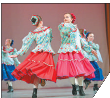
На конкурс было подано 353 заявки.

Ансамбль «Сказка» Правобережного дома детского творчества стал лауреатом регионального смотра-конкурса «Родина моя» в номинации «Хореография». Жюри отметило танец «Девичий казачий» в исполнении средней группы ансамбля. В 2022 году конкурс проходил в онлайн-формате. Творческими коллективами и солистами было создано много новых номеров патриотической тематики.