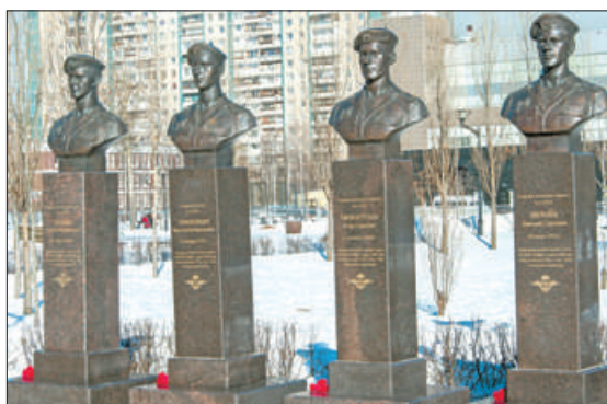
Участники церемониала почтили память погибших бойцов минутой молчания, а также возложили венки и цветы к монументу в честь десантников 6-й роты и к бюстам героев.