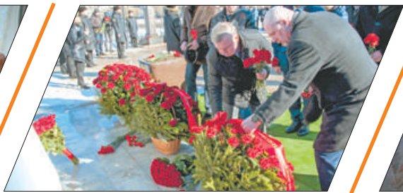
ПАМЯТЬ О ПОДВИГЕ ДЕСАНТНИКОВ 6-Й РОТЫ