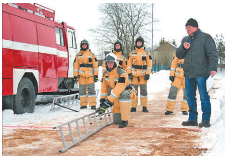
Подготовка к подъёму по штурмовой лестнице.

На базе Пожарно-спасательного колледжа «Санкт-Петер-