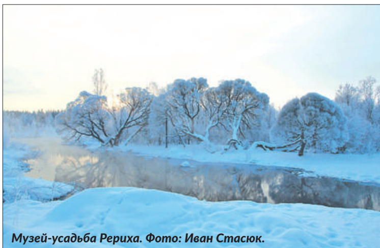
Музей-усадьба Рериха.