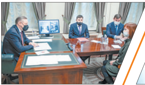
НОВОСТРОЙКАМ – ШКОЛЫ И ПОЛИКЛИНИКИ