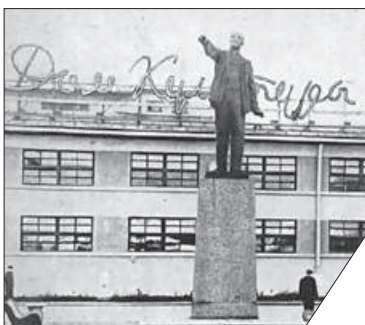
Это было одно из первых учреждений в стране, названных именем Ленина.

Культурный центр «Троицкий» – замечательное творение советского архитектурного конструктивизма 20–30-х годов. Старожилы района помнят, как в советское время на его сцене (тогда он назывался Дворец культуры имени В. И. Ленина) выступали Утёсов, Шульженко, Райкин, Высоцкий. В 1990-е гг. перед зданием исчез памятник В. И. Ленину. Остался только постамент... Нам стало интересно, а кого хотели бы видеть на нём сегодняшние жители района, кружковцы и посетители КЦ? Ждём ваших мнений по адресу: l.az@mail.ru.