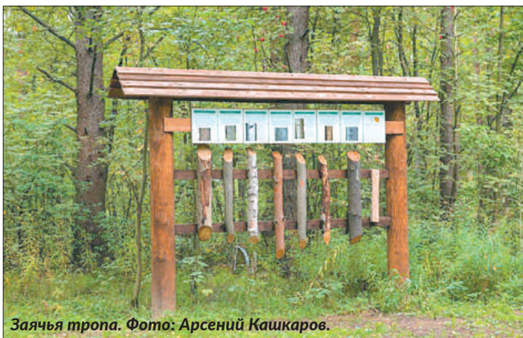
Заячья тропа.

7 Заячья тропа (3,2 км) проходит по сосновому лесу. 8 Малиновая гора (2,3 км). А здесь лес еловый, причём встречаются ельники черничные, ельники кисличные, ельники папоротниковые и др., плюс можно полюбоваться на Кавголовское озеро. 9 Верста (1 км). Проходит по камовым холмам, пересекая межкамовую котловину.