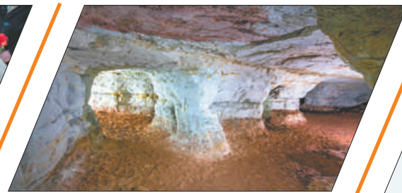
ЕДЕМ В ОТПУСК НА ОДИН ДЕНЬ