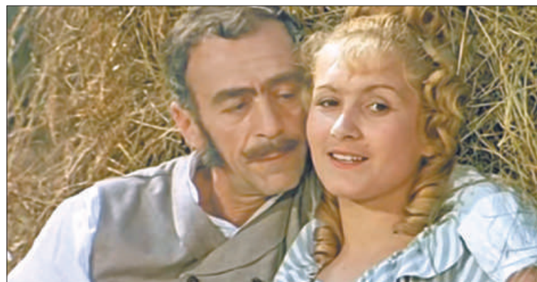
Феликс, слуга Фадинара. «Соломенная шляпка» (1974).