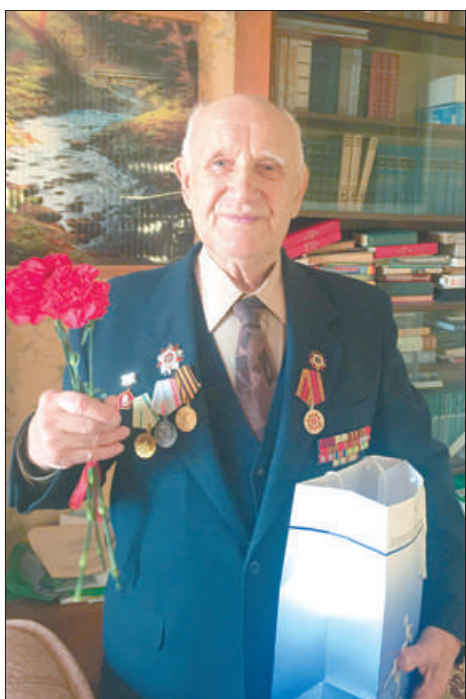
Юбилейные медали «75 лет Победы в Великой Отечественной войне 1941–1945 гг.» вручались ветеранам, в том числе на дому с участием волонтеров Победы.

В юбилейном году осуществлялись мероприятия по вручению ветеранам медалей «75 лет Победы в Великой Отечественной войне 1941–1945 гг.». В Невском районе их было вручено 8685, в том числе на дому (с участием волонтеров Победы) 18 ветеранам, достигшим возраста 100 лет и старше, а также шести ветеранам района медали вручены губернатором Санкт-Петербурга в государственной резиденции К-2.