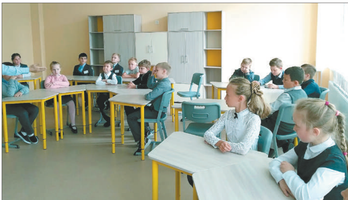
В 2020 году образовательные услуги получали более 81 тысячи человек в 165 образовательных учреждениях.

Все выпускники 9-х и 11-х классов получили аттестат. 205 выпускников 9-х классов получили аттестат особого образца. 152 выпускника 11-х классов получили медаль «За особые успехи в