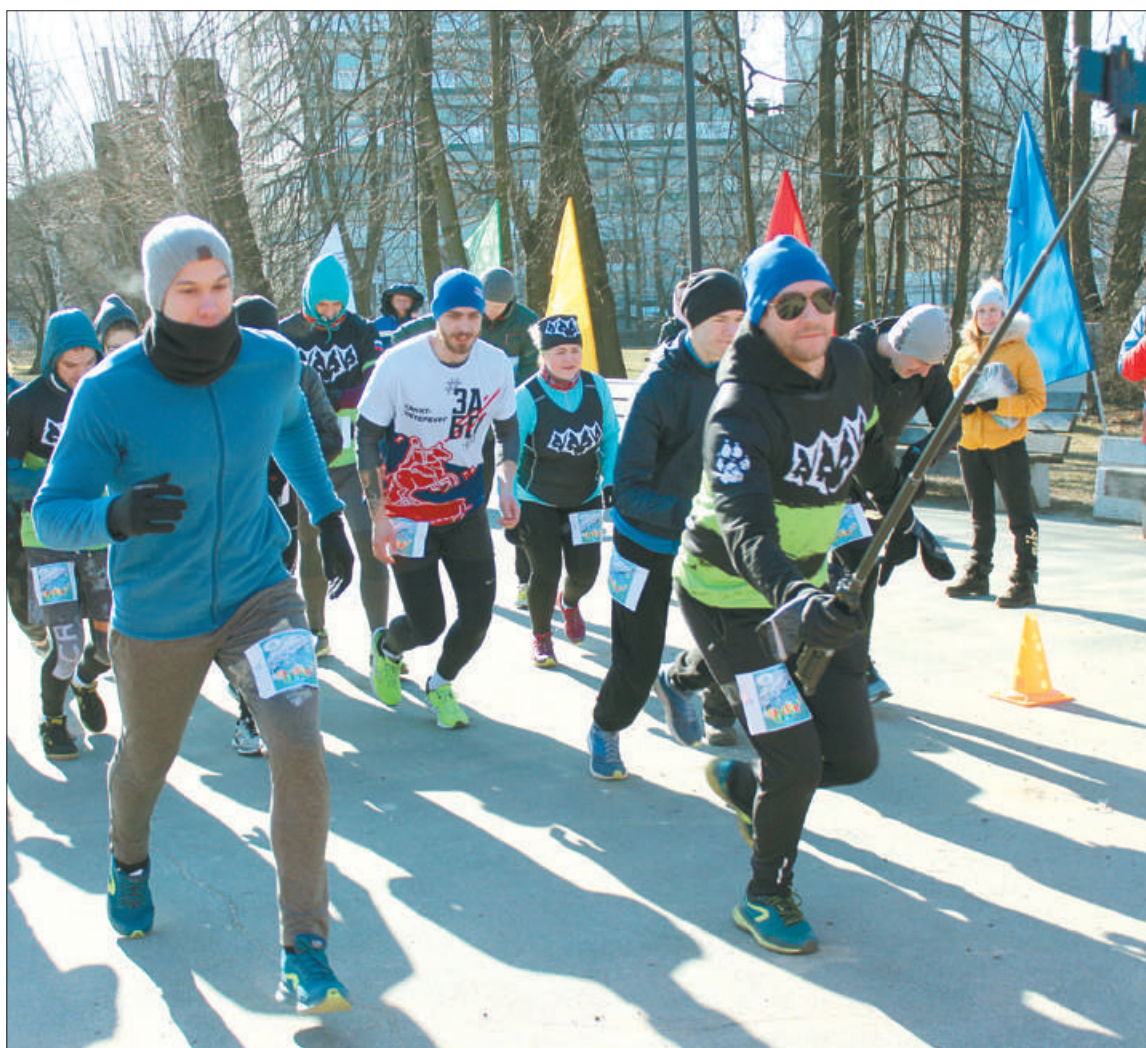
За год проведено более 250 спортивно-массовых мероприятий, в которых приняли участие более 10 тысяч человек.

В Центре физической культуры, спорта и здоровья Невского района ведут работу 10 секций: волейбол, мини-футбол, хоккей с шайбой, фигурное катание, фитнес-аэробика, новус, настольный теннис, бокс, акробатический рок-н-ролл и флорбол.