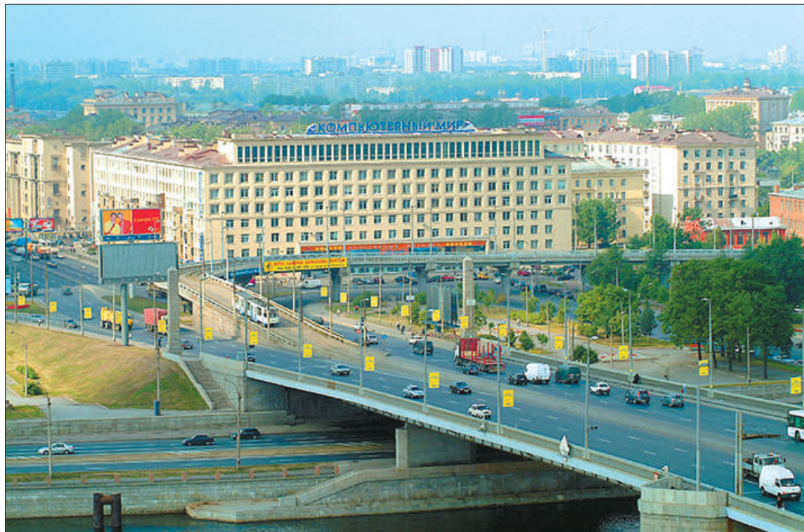
Сегодня Володарский мост – пятипролётное металлическое сооружение длиной 416,7 метра и шириной 36,8 метра, состоящее из двух речных, двух береговых пролётов и разводного пролёта в центре.

В проекте Володарского моста Г. П. Передерий с коллегами применили ряд инновационных для того времени технических ре-