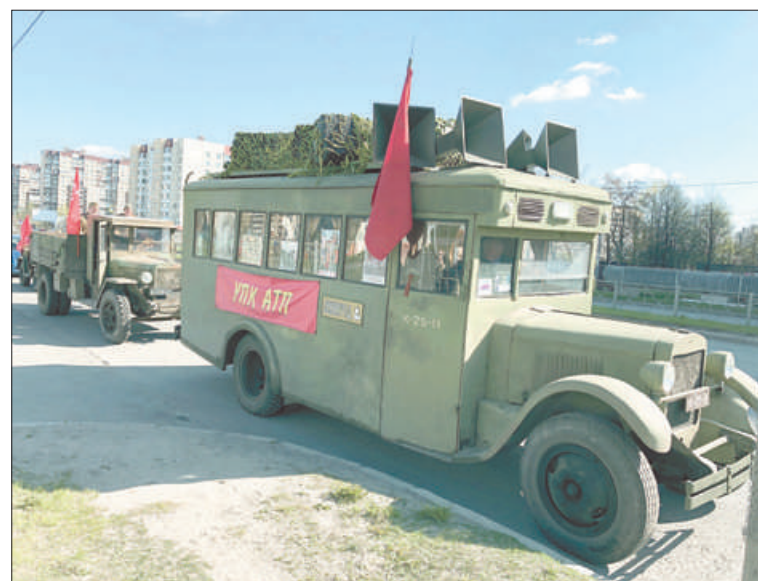
9 Мая по улицам района торжественно проехали военные автомобили и техника времён войны.