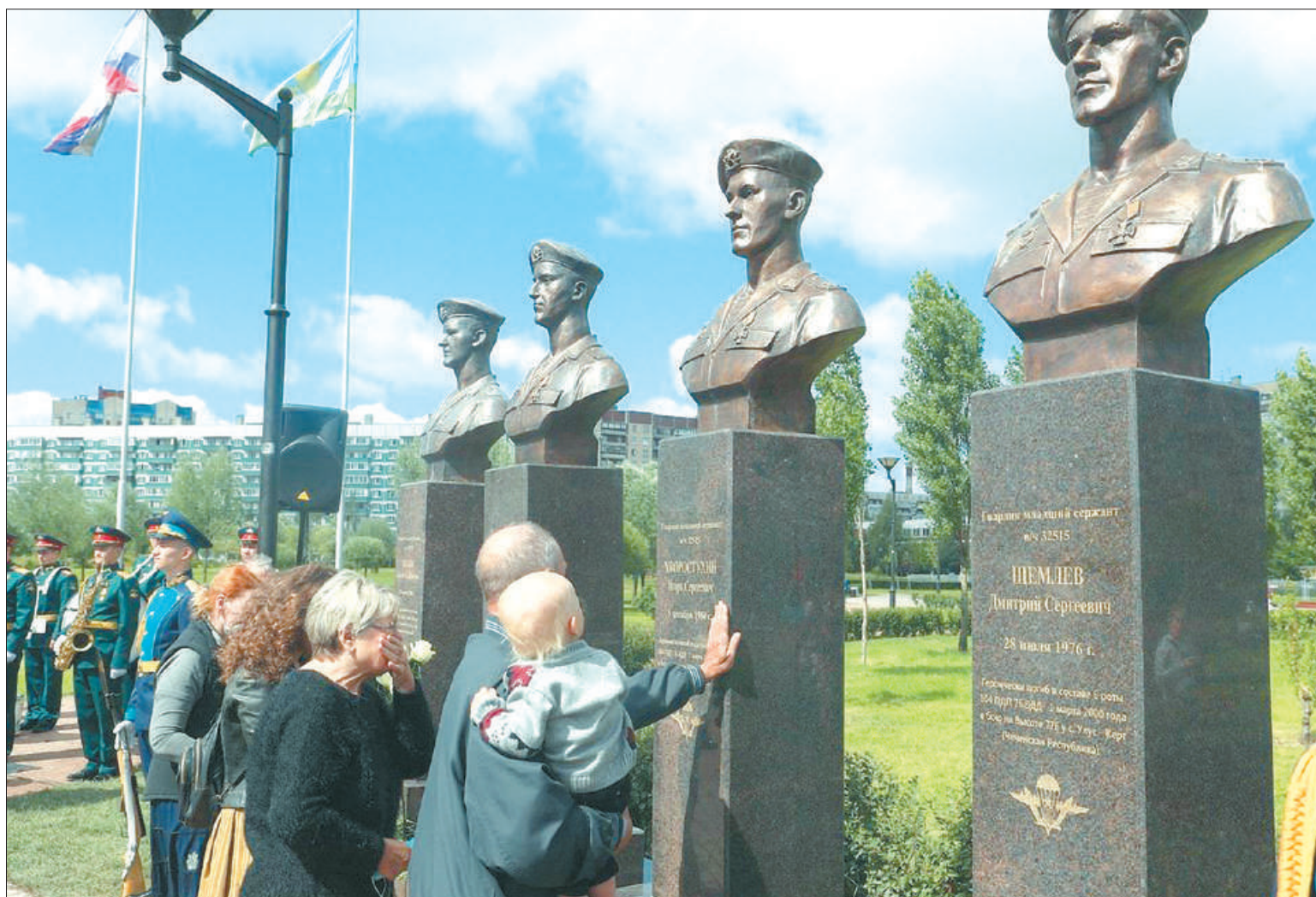
В парке Боевого братства состоялась торжественная церемония открытия памятников-бюстов воинам-десантникам 6-й парашютно-десантной роты 104-го гвардейского парашютно-десантного полка 76-й гвардейской воздушно-десантной дивизии.

культурных проектов было реализовано администрацией Невского района.