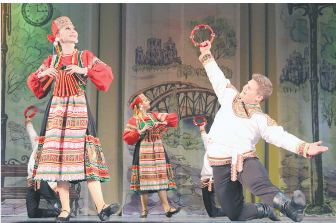
Культурный центр «Троицкий» реализовал новый детский проект «Дом сказок», провёл традиционный Фестиваль творчества людей старшего поколения «Золото в годах», Молодёжный открытый песенный конкурс «В Питере – пять!» и другие мероприятия.

Музей «Невская застава» активно работал в интернет-пространстве, реализуя креативные музейные проекты на официальном сайте и официальных страницах в социальных сетях. Проведено 232 мероприятия, в том числе 52 – онлайн: передвижная интерактивная выставка «Детское время», «Праздник улицы», пешеходные экскурсии «Все карты в руки», «Огни Ивановской магистрали», «Район без излишеств» и др.