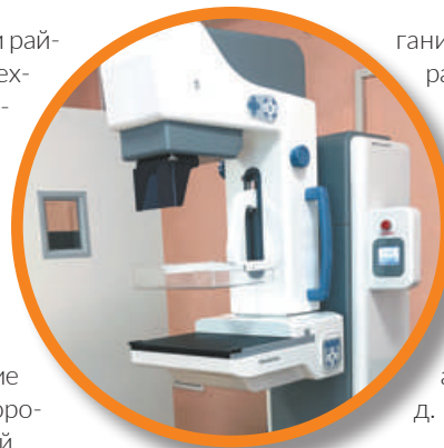
Закуплено оборудование в 11 учреждений здравоохранения на общую сумму почти 70 млн руб.

Обеспечено проведение выплат стимулирующего характера за особые условия труда и дополнительную нагрузку медицинским работникам, оказывающим медицинскую помощь гражданам с COVID-19 за счёт средств резервного фонда Правительства РФ на сумму более 240 млн руб. Для обеспечения доступности медицинской помощи при обслуживании квартирных вызовов в условиях распространения коронавирусной инфекции предоставлены в рамках договора аренды дополнительные транспортные средства в количестве 26 автомобилей, закуплено 9 автомобилей. Ор-