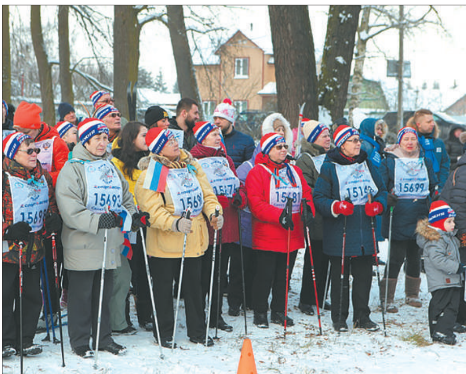
10 февраля в Невском лесопарке на лыжной базе СШОР № 2 Невского района стартовала XXXVI открытая Всероссийская массовая лыжная гонка «Лыжня России-2018». Наряду с любителями спорта на старт вышли профессионалы и ветераны спорта. В гонке приняли участие более тысячи человек.

45 тысяч жителей района стали активными участниками и болельщиками спортивных соревнований.