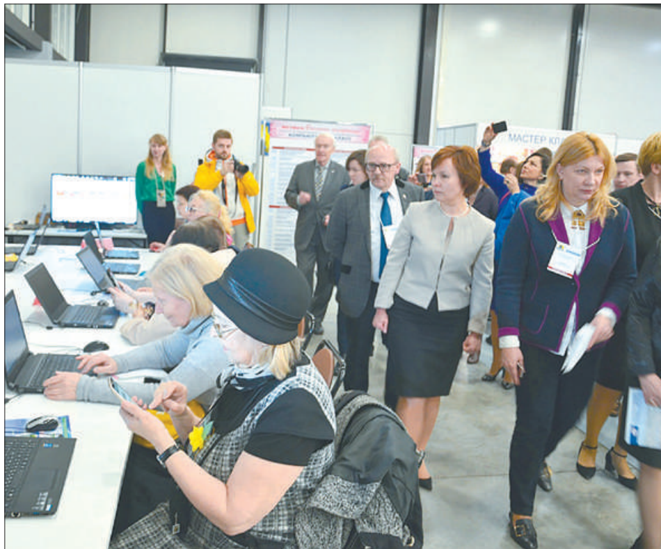
Специалисты социально-досугового отделения ежедневно проводили мастер-классы по компьютерной грамотности, пользующиеся большой популярностью у гостей форума «Старшее поколение».

521 ветерану Великой Отечественной войны вручили персональные поздравления Президента Российской Федерации.