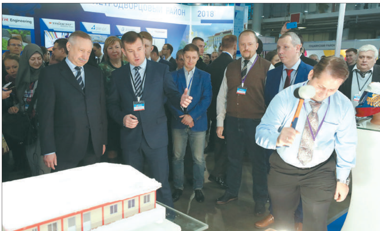
Временно исполняющий обязанности губернатора города Александр Беглов и глава Невской администрации на XVI Форуме малого и среднего предпринимательства Санкт-Петербурга.