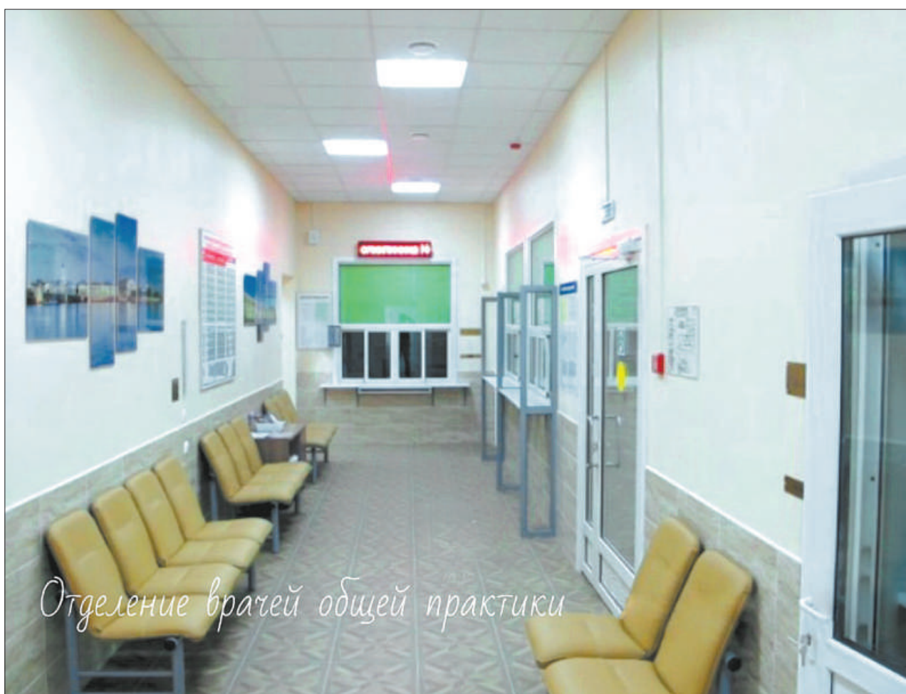
Отделение врачей общей практики

100 тысяч человек прошли диспансеризацию, а это – пятая часть жителей района.