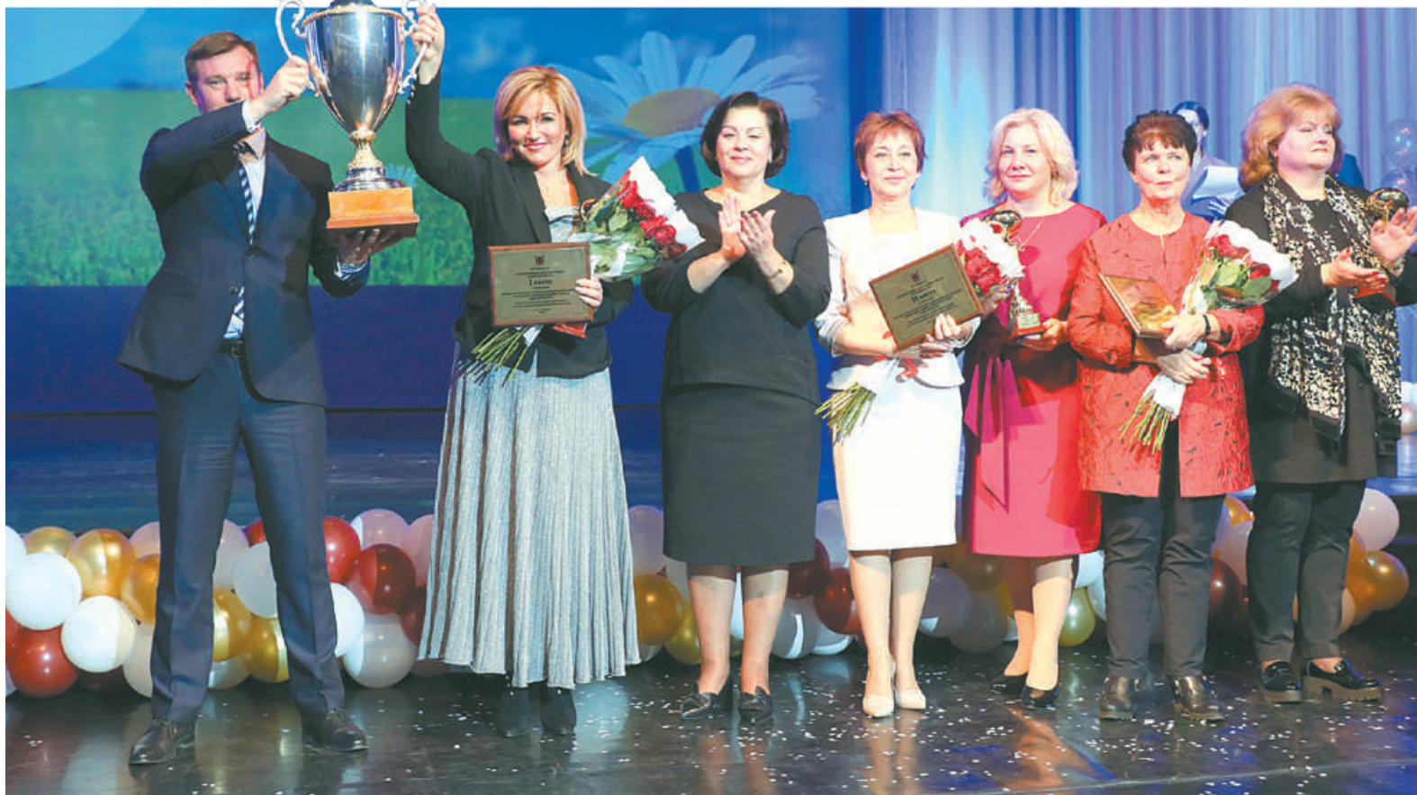
Администрация района четвертый год подряд получает призовые места за организацию летней оздоровительной кампании.