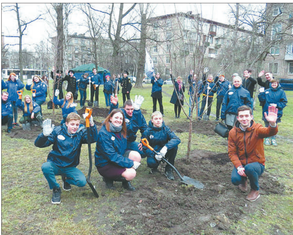
В Палевском саду появилась Аллея добровольцев – символ жизни, добра и бескорыстия. Участники акции высадили 10 яблонь.

35 тысяч человек приняли участие в районных и клубных молодёжных мероприятиях.