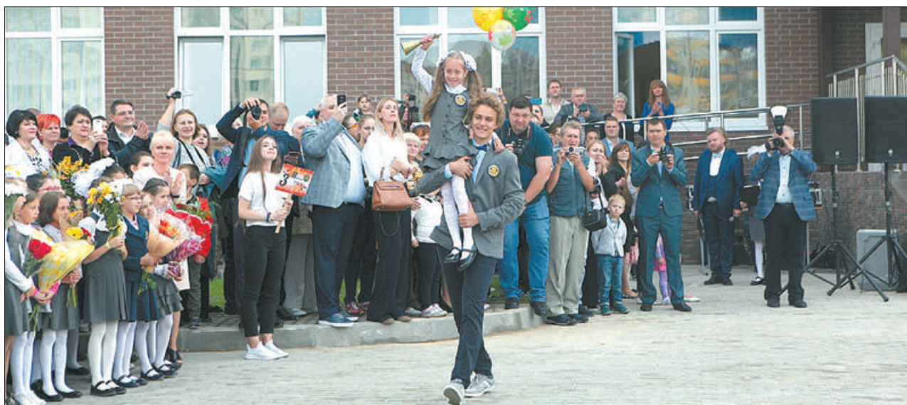
1 сентября в Невском районе открылась новая общеобразовательная школа № 691 с углубленным изучением иностранных языков.

22 школы района внедрили инклюзивное обучение. Кстати, школа № 627, где обучаются дети с нарушениями опорно-двигательного аппарата и интеллектуальными нарушениями, заняла II место на Всероссийском конкурсе в номинации «Лучшая здоровьесберегающая школа».