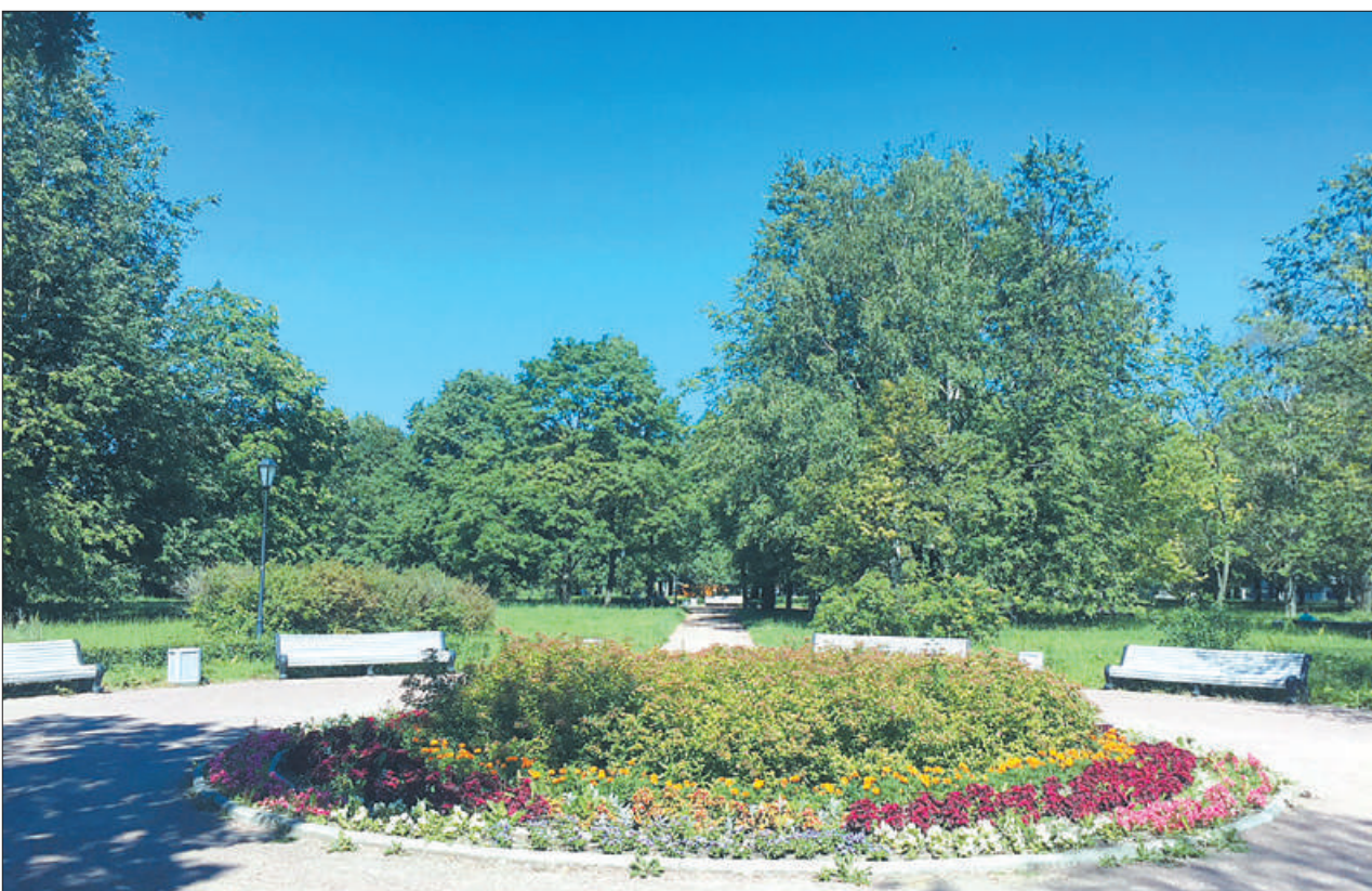
Парк «Куракина дача» – лучший объект благоустройства, заявлявшийся на городской конкурс в течение последних пяти лет.

Решением городской комиссии по подведению итогов ежегодного смотра-конкурса на лучшее комплексное благоустройство территорий районов Санкт-Петербурга в 2018 году Невский район занял 3-е место среди районов второй группы.