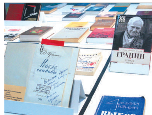
К столетию Даниила Гранина в библиотеке его имени был создан культурно-просветительский центр.

8000 петербуржцев собрал Ивановский фестиваль «Территория добрососедства».