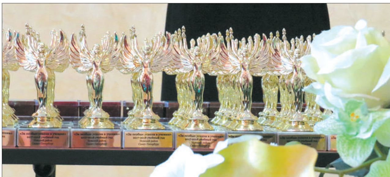
154 выпускника получили награды: 141 выпускник – медаль «За особые успехи в учении», 24 выпускника – почетный знак «За особые успехи в обучении». 11 человек были награждены и медалью, и почетным знаком.

Конечно, не забываем и о материально-технической базе, и о спортивных площадках – расходы на образование в 2018 году составили 73,7% всего районного бюджета. Но ведь и результаты есть!