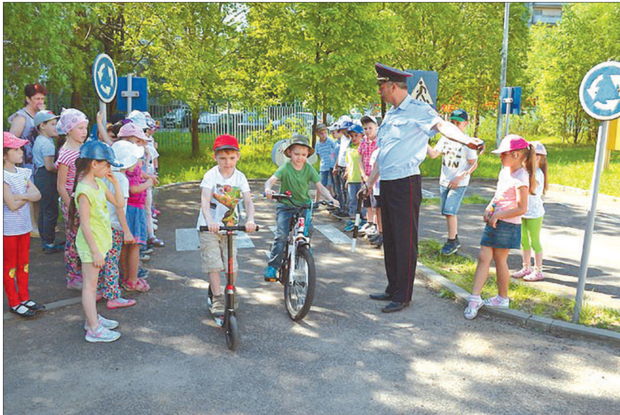
Сотрудники ГИБДД объяснили маленьким участникам дорожного движения в Невском районе азы безопасного поведения на дорогах.

Охрану общественного порядка на территории района совместно с УМВД России осуществляли два общественных объединения: Санкт-Петербургская региональная общественная организация «Добровольная молодёжная дружина» (114 чел.) и общественная организация «Народная дружина «Невская» (185 чел.). Более 100 дружинников приняли участие в районе в мероприятиях, посвященных Дню знаний.