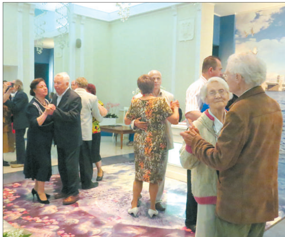
В День семьи памятные медали «За любовь и верность» были вручены 22 супружеским парам, имеющим стаж семейной жизни 25 лет и более.