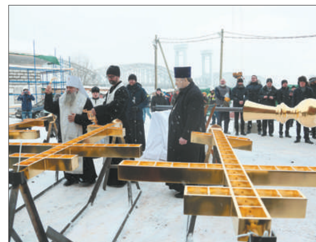
Скорбященский храм построен в конце XIX века на народные деньги по проекту знаменитых архитекторов Александра фон Гозена и Александра Иванова. В 1933 году он был закрыт и взорван.