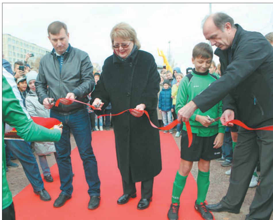
20 октября состоялось торжественное открытие футбольного стадиона у гимназии № 528. В Невском районе появилась спортивная площадка с полноразмерным футбольным полем. Глава района совершил первый символический удар с 11-метровой отметки и забил гол в ворота молодого вратаря.