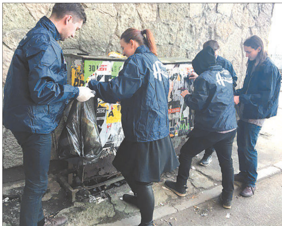
Добровольцы подростково-молодёжного клуба «Огонёк» провели акцию «Культурной столице – чистые дворы!».