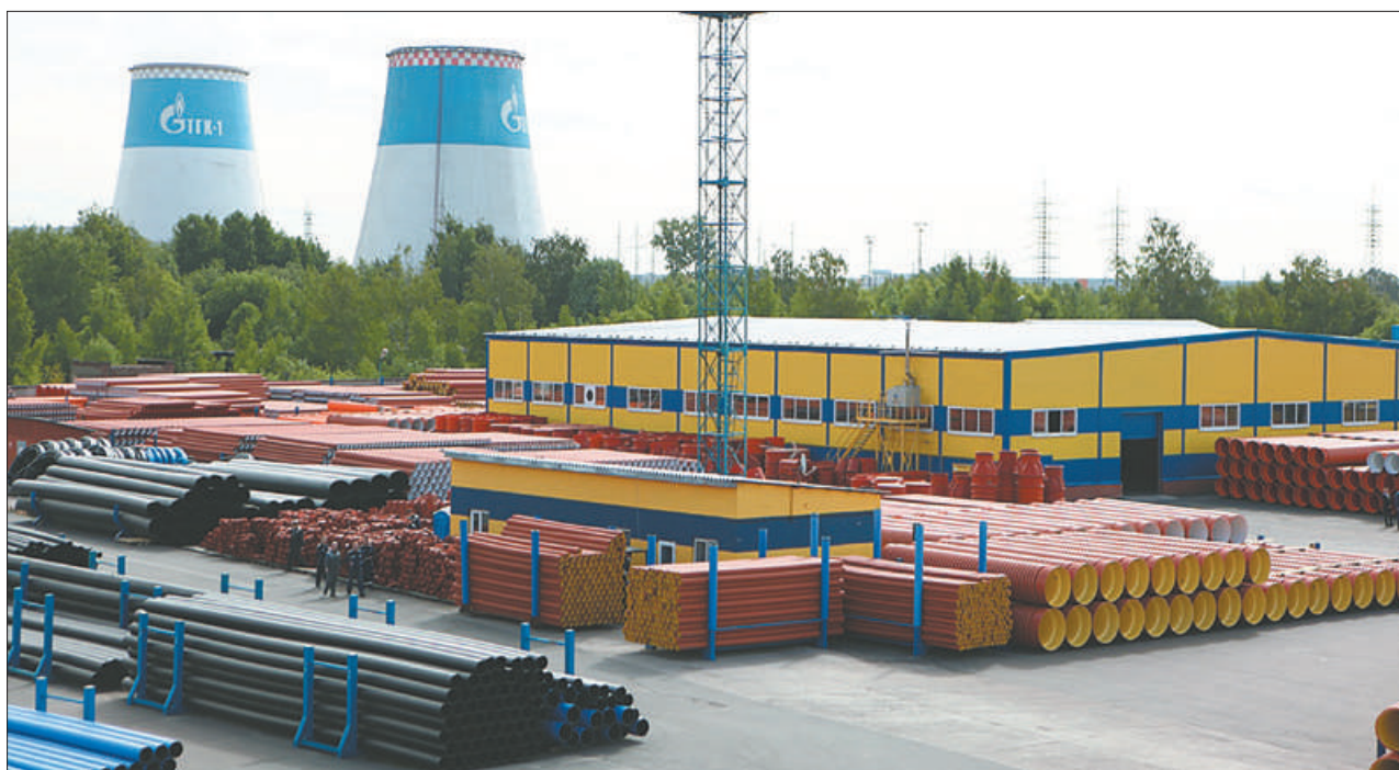
На трубном заводе «ИКАПЛАСТ», расположенном в Невском районе, состоялась запуск новой производственной линии, которая будет производить порядка 6 тысяч канализационных колодцев большого диаметра в год.