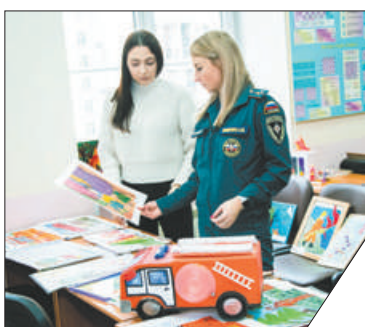
Лучшие работы будут направлены для участия в городском этапе конкурса.

В Центре детского (юношеского) технического творчества «Старт+» подведены итоги районного этапа конкурса детского творчества ««Неопалимая купина». В первом этапе приняли участие 325 конкурсантов из 54 образовательных учреждений. Жюри в составе сотрудников управления Невского района ГУ МЧС по Санкт-Петербургу, Пожарно-спасательного отряда Невского района, Невского отделения СПб ГО «Всероссийского добровольного пожарного общества» оценило конкурсные работы и определило победителей.