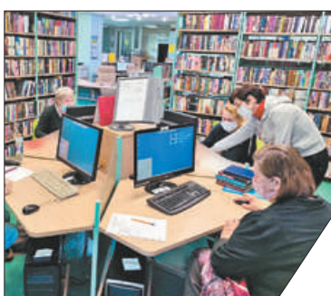
Подробнее – по телефону 362-44-97. В группе ВКонтакте: https://vk.com/nevcbcs4 .

Отправить письмо по электронной почте, зайти на сайт «Госслуги», пообщаться с близкими по видеосвязи сегодня должен уметь каждый. Библиотека № 4 на Троицком поле приглашает на бесплатные курсы компьютерной грамотности для людей пожилого возраста. Занятия проходят в группах по четыре человека два раза в неделю – в среду и пятницу в 12.30 по адресу: ул. Бабушкина, д. 135. Начало занятий по мере комплектования группы.