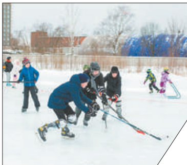
Каток открыт с 08.00 до 22.00. Подробнее – по тел. 329-05-17.