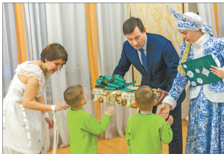
Воспитанники социальных учреждений района получили подарки, подготовленные благотворителями в рамках акции «Ёлка добра».