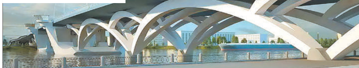
Начато проектирование Большого Смоленского моста.