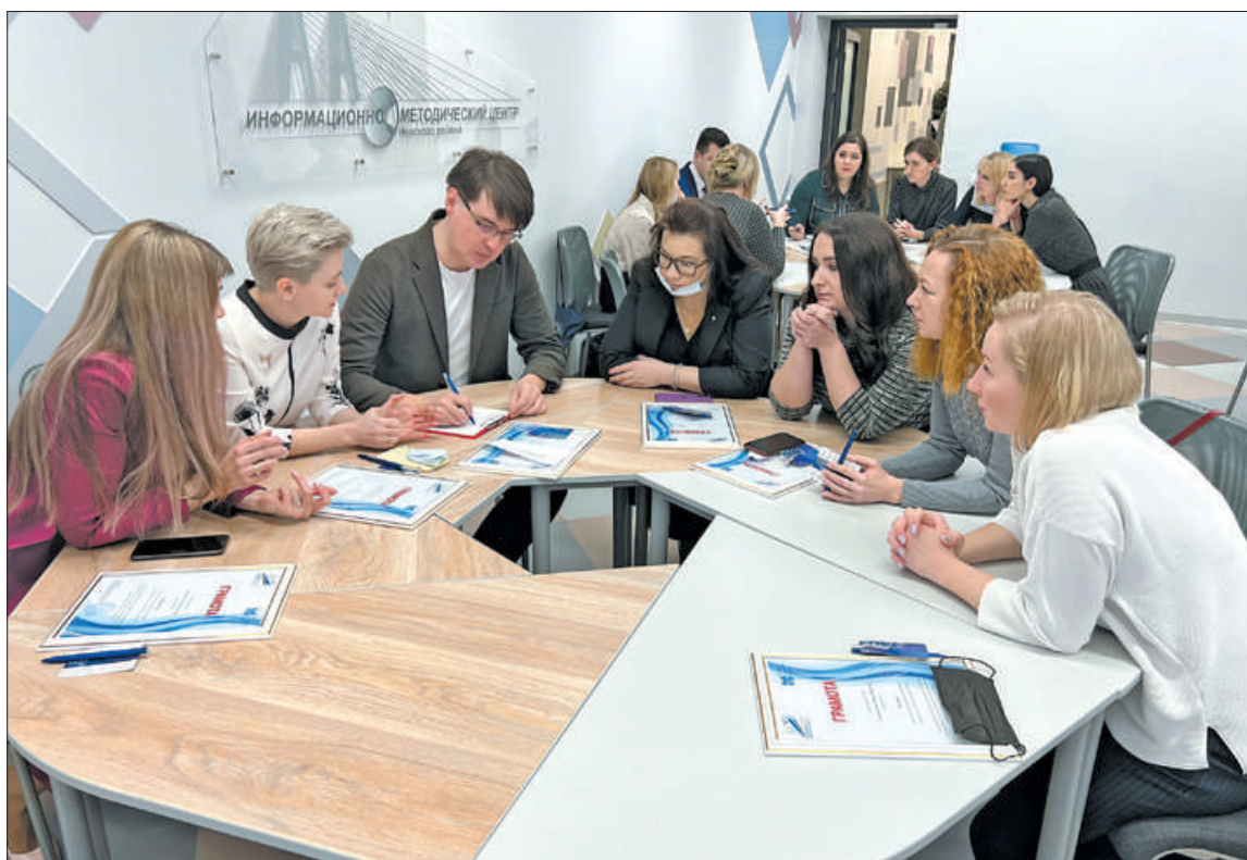
В Информационно-методическом центре Невского района ежегодно повышают квалификацию около 2 тысяч педагогов.