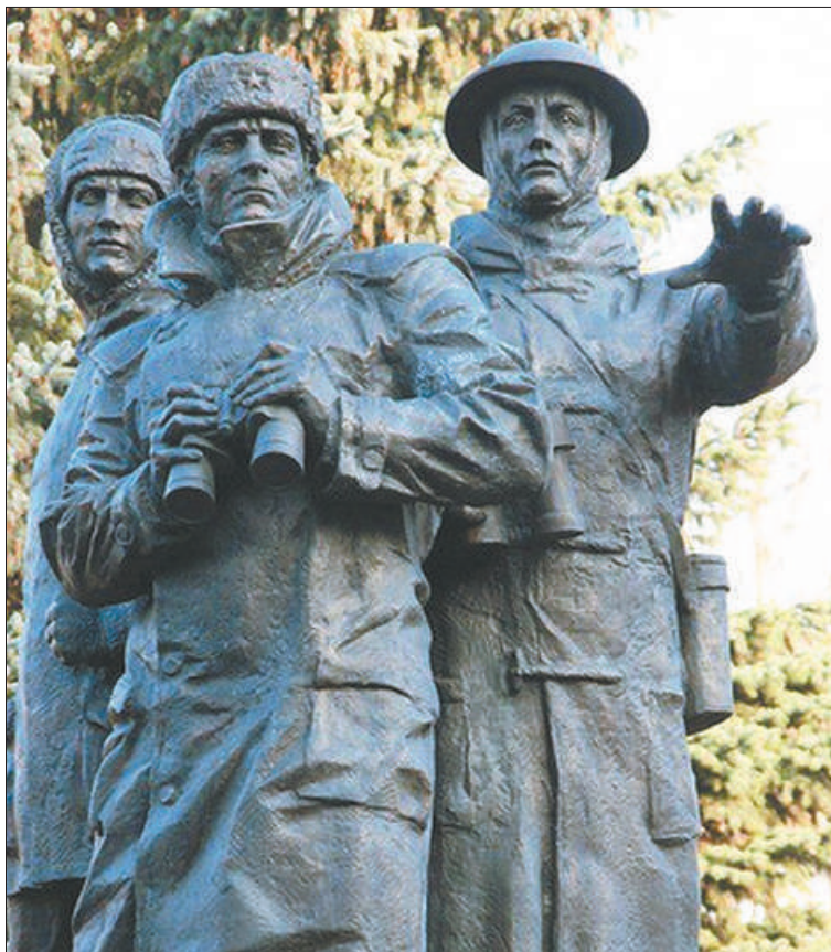
Памятник в сквере Морского колледжа открыли в 2014-м – на постаменте в виде мостика корабля изображены три фигуры: советский, английский и американский солдаты всматриваются в ледяную даль.

«До приезда в нашу страну британские ветераны даже не подозревали, какой почёт их здесь ожидает! Простые люди бежали к ним, чтобы пожать руку, а каждый военный отдавал им честь!»